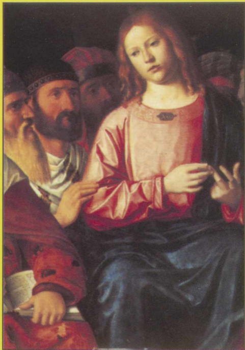
ZNALEZIENIE PANA JEZUSA