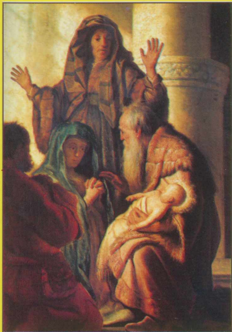
OFIAROWANIE PANA JEZUSA