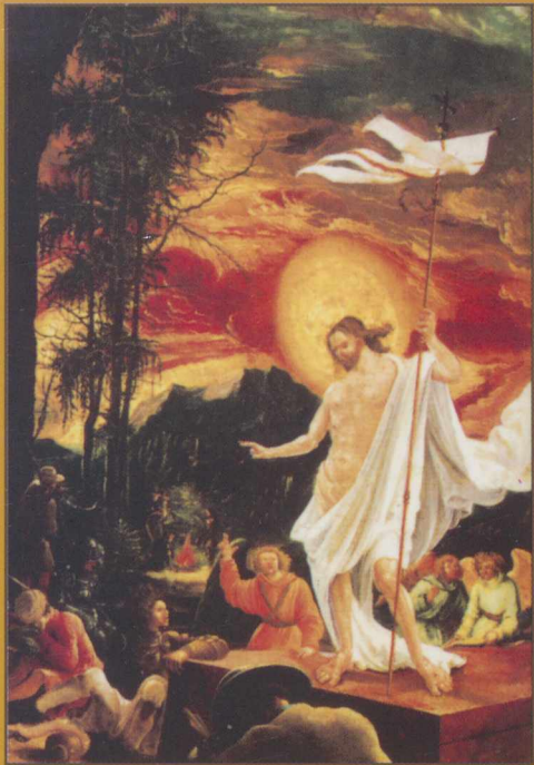
ZMARTWYCHWSTANIE PANA JEZUSA