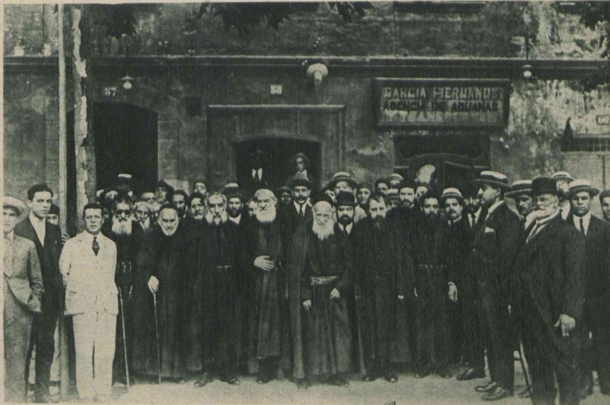
Muley Hassan ben Muley el Mehedi ibn Muley Ismail ibn ben Muley Hassan — oto nazwisko nowego kalifa hiszpańskiej części Marokka. Proklamacja jego odbyła się w Tetuanie z wielkimi uroczystościami, z udziałem duchowieństwa wszystkich wyznań. Na drugim zdjęciu charakterystyczna grupa rabinów żydowskich, którzy wzięli udział w proklamacji.