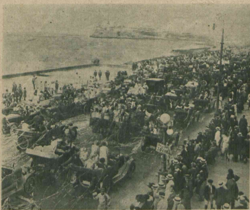
Całą Europę środkową nawiedziła w ostatnim tygodniu fala wielkich mrozów, która nie ominęła także i Polski. Mrozy w wielu miejscowościach przecho- dzily 20° C. Tem dziwniejsze wydadzą się powyższe zdjęcia, których w tym samym czasie dokonano i to stosunkowo nie daleko od nas, a mianowicie na Riwierze, odległej od Polski 2 doby jazdy koleją a tylko 10 godzin samolotem. Jak widzimy, jest tam piękna, ciepła pogoda, a tamtejsze słońce zimowe w ni- czym nie ustępuje naszemu letniemu. Zdjęcie na lewo przedstawia moment z turnieju tenisowego w Cannes. Na zdjęciu (na lewo) widoczna słynna Zuzanna Lenglen, mistrzyni świata w tenisie. Przepiękne obramowanie z palm dodaje temu obrazkowi specjalnego uroku. Zdjęcie górne przedstawia promenadę w Mentonie, nad wybrzeżem morskim, całem tonącym w promieniach słońca. Liczni kosmopolityczni kuracjusze „opalają się” na moło. Zdjęcie dolne jest już z odleglejszych stron, a mianowicie z Havanny. Na wybrzeżu morskim Havanny urządzono na rozpoczęcie karnawału 'corso kwiatowe, w którym wzięło udział 6.000 samochodów.