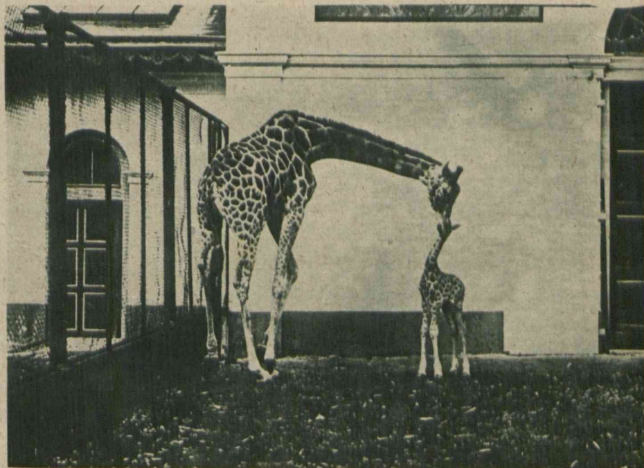
1) W stanie Montana (St. Zj.) rozmnożyły się znowu olbrzymie hordy dzikich koni, które stały się plagą ludności. Władze postanowiły konie wytępić, wychodząc z założenia, że w czasach samochodów Forda nie posiadają one żadnej wartości. — 2) Pierwsza w Europie żyrafa przyszła na świat w dreźnieńskim ogrodzie zoologicznym. Mimo jednakże troskliwej opieki, zakończyła żywot po 4-ech tygodniach z powodu zmiennej pogody i gwałtownych mrozów.