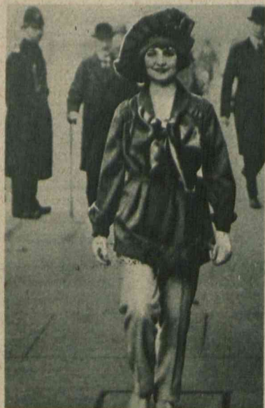
Odważa zdobi nie tylko młodzieńca lecz i młodą damę. Oto kostjum, w jakim młoda amerykańska „girl” wymaszerowała na ulicę swego „city”.