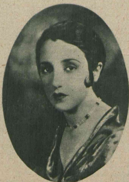
Bebe Daniels, znana diva filmowa, nie potrzebuje reklamy, natomiast domaga się tego jej nowa fryzura.