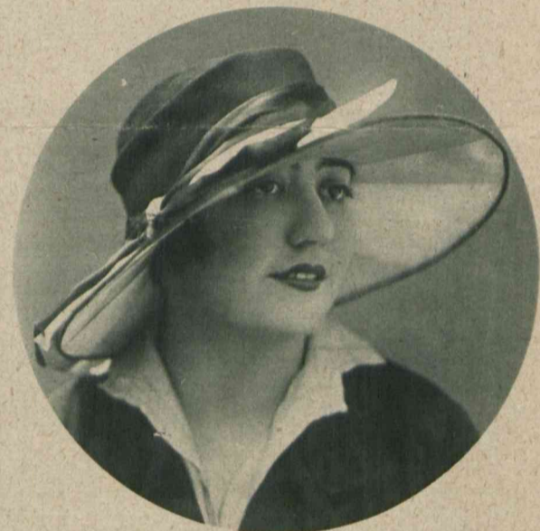
Duży czy mały? Wprawdzie moda twierdzi kategorycznie, że tylko mały, jednakże każda piękna dama nie cofnie się przed uchybieniem modzie, jeżeli jej w dużym będzie do twarzy. Ostatnia kreacja magazynu „Blanchet et Simone” w Paryżu.