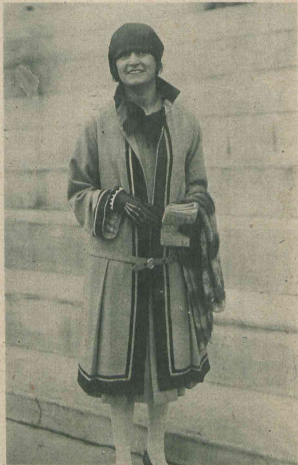
Ponieważ w zimie modne były wielkie dekolty, więc wraz z zbliżającą się wiosną nie pozostało panom nic innego, jak gwałtowne ich zmniejszenie i trwożliwe zasłonięcie szyi przed natarczymi promieniami słońca. Kosztum „cashy” na wyścigach w Auteuil pod Paryżem.