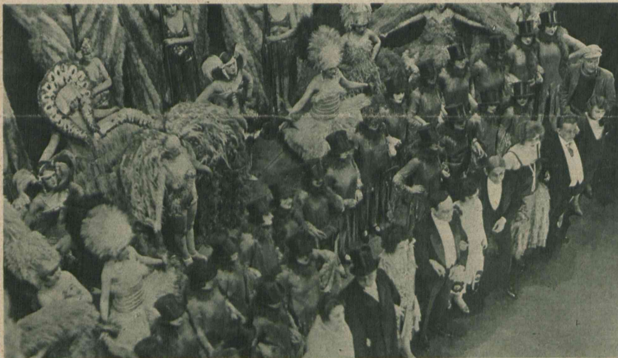
Świat oglądany z góry. Widok na scenę podczas rewji „Paryż bez koszulki” w jednym z paryskich kabaretów. Przepuszczalnie za kilka lat popularną tę rewję odgrywać będą mogli wszyscy mieszkańcy Europy i to bynajmniej nie dla zabawienia bliźnich, ale z powodu przykrej konieczności.