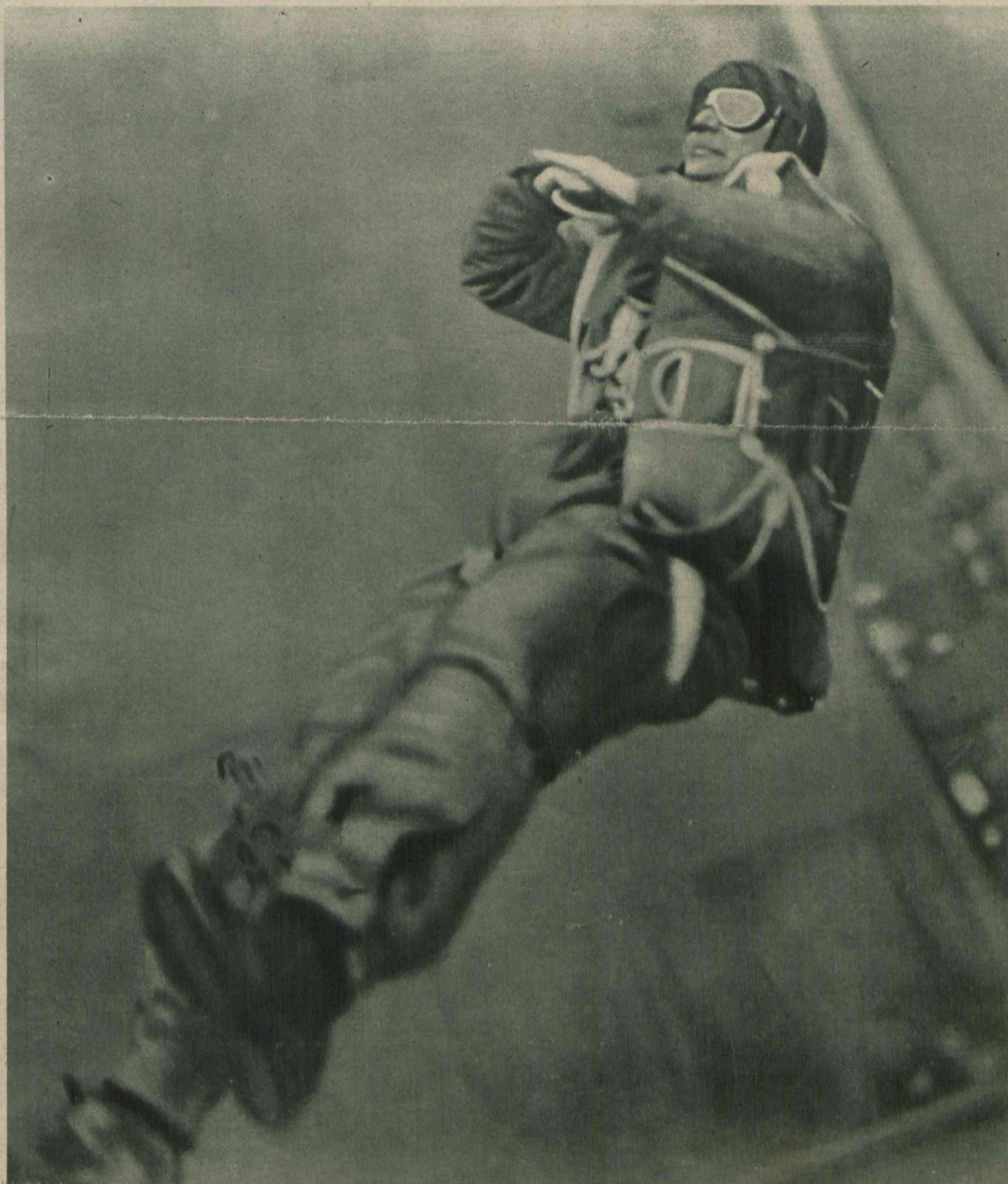
Najwyższą próbą nerwów jest bezwątpienia skok z aeroplanu ze spadochronem. Powyższego zdjęcia dokonano w pierwszym momencie skoku, gdy lotnik oderwawszy się już od samolotu, dopiero w przestworzu otwiera mechanizm rozwijający spadochron. Samolot, należący do armji angielskiej, znajdował się na wysokości 800 metrów.