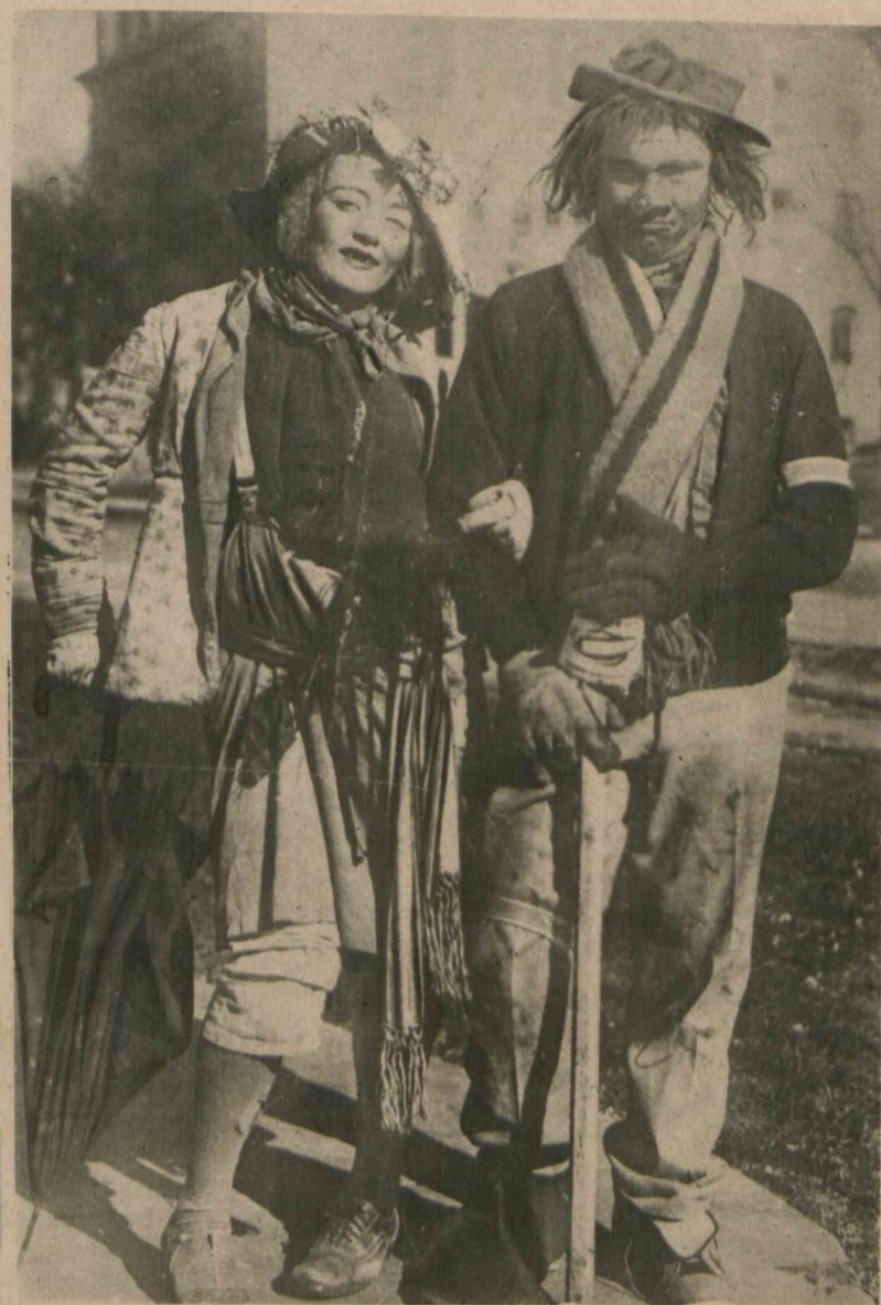
Na uniwersytetach kalifornijskich odbywa się przed świętami konkurs, na najlepiej odtworzone typy włóczędzów. Powyższa para wygrała konkurs w bieżącym roku, za co może odbyć podróż po Stanach Zjednoczonych podczas świąt bezpłatną... ale w konkursowym kostiumie.