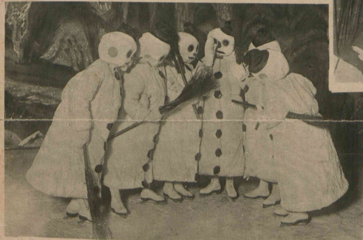
Brak śniegu zmusza nas do bawienia się żywymi „bałwanami śniegowymi”. Na obrazku widzimy, że „bałwanki” szeptały coś tajemniczo między sobą. Kto wie, czy nie obawiają się konkurencji prawdziwego śniegu i prawdziwych bałwanów.