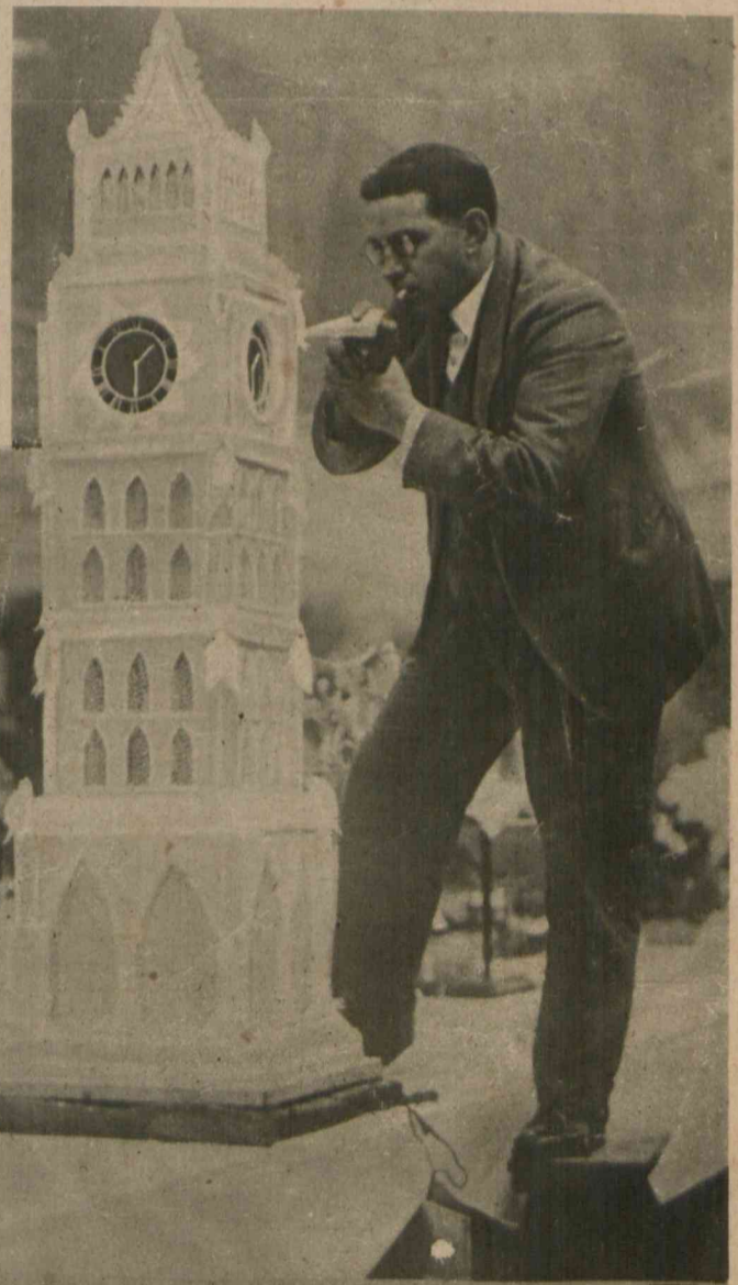
Na świątecznej wystawie gastronomicznej w Londynie znajduje się model wieży, który wzięty podobno został z bajki o Jasiu i Małgosi. Jest on mianowicie cały zrobiony z cukru.