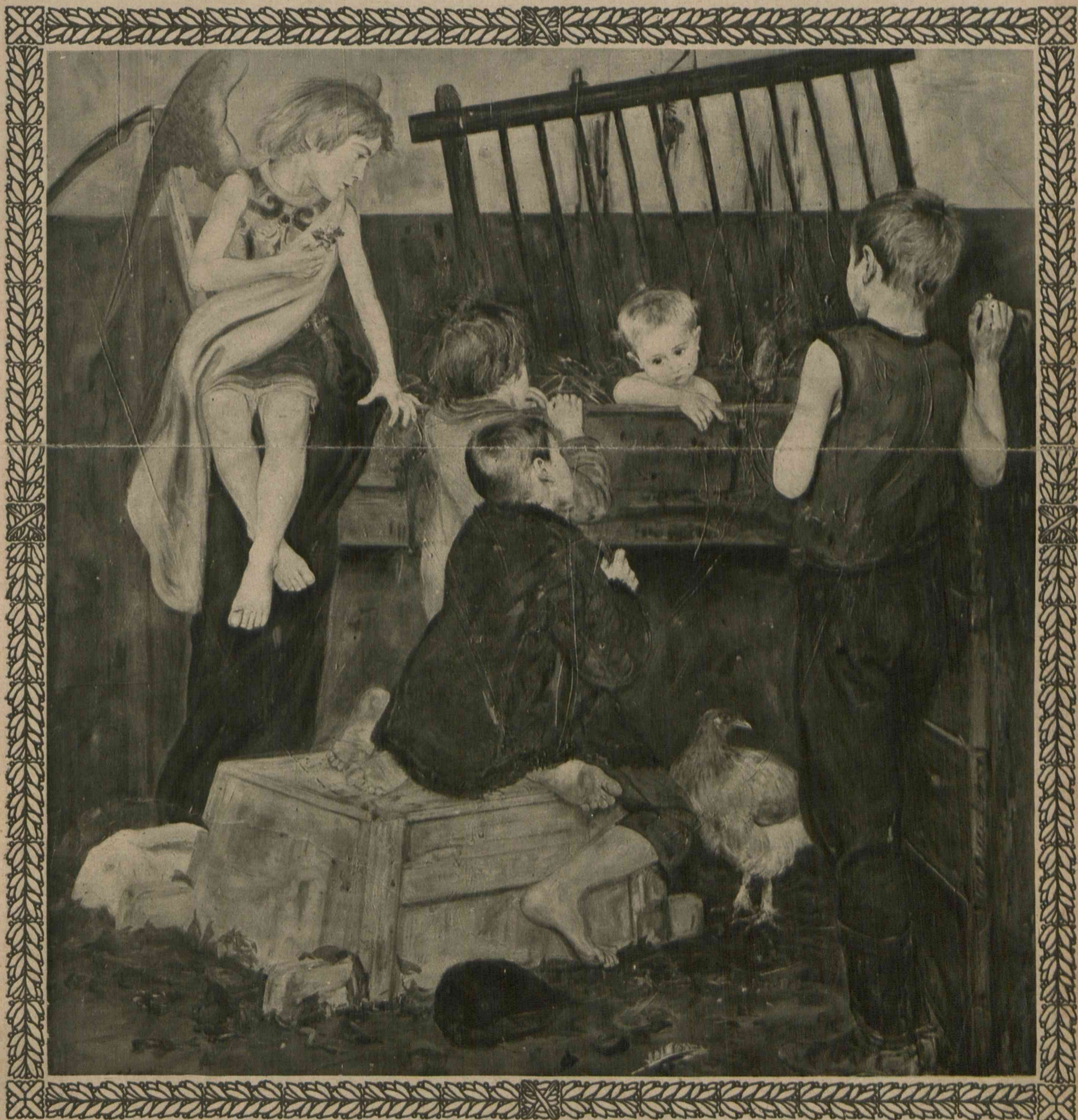
„Jasełka“, obraz Vlastimila Hofmana, znanego artysty polskiego. W żłobie stajennym siedzi malutki P. Jezus i rozmawia z trzema wiejskimi chłopakami; na końcu żłóbka usiadł anioł i przypatruje się z czułością Dzieciątku. Obraz znajduje się w posiadaniu Muzeum Wielkopolskiego w Poznaniu.