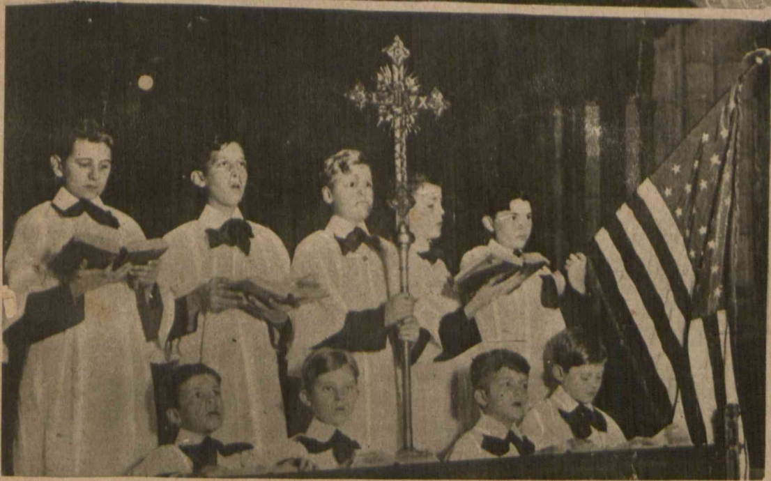
Koncert słynnego chóru chłopięcego, podczas świąt Bożego Narodzenia w kościele św. Tomusza w Nowym Jorku.