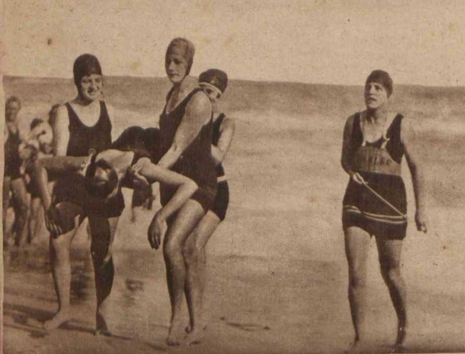
W Bondi Beach (Australja) zawiązał się klub pływacki, mający na celu ratowanie tonących.