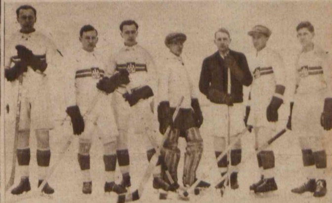
Na wspaniałej skoczni Karpackiego Tow. Narciarzy na Zniesieniu, odbył się onegdaj pierwszy na wielką skalę we Lwowie konkurs w skokach narciarskich.