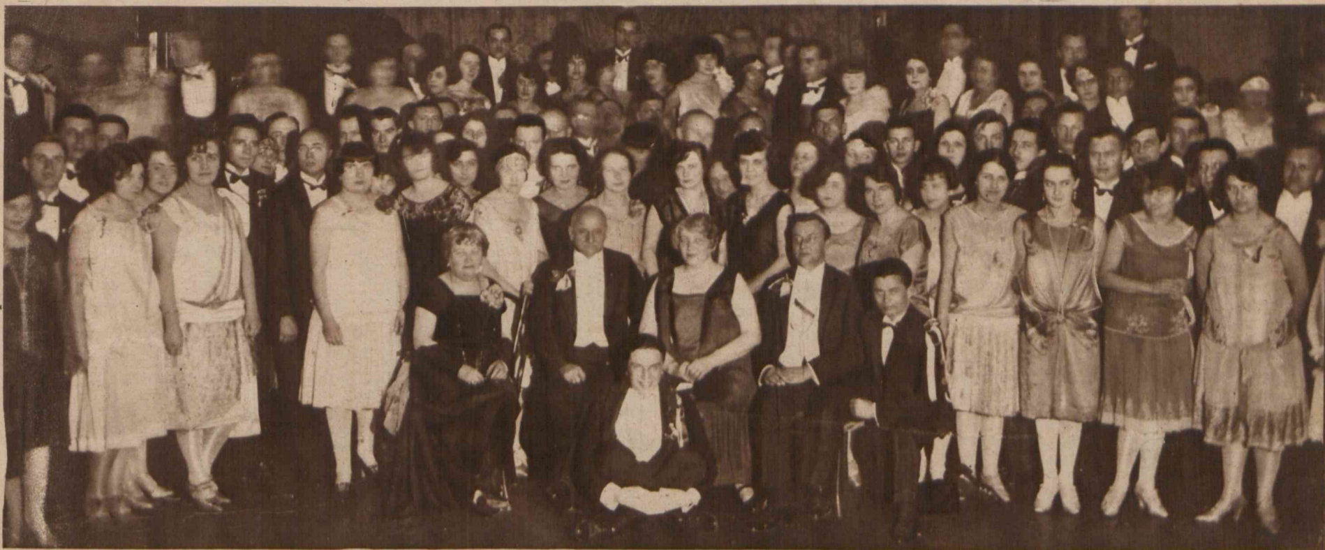
Pierwszy bal słuchaczy wyższej szkoły dla handlu zagranicznego odbył się w tych dniach w żółtej sali Muzeum technologicznego we Lwowie, zapelniając się setkami gości.