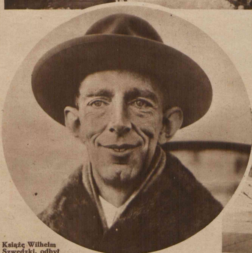
Książę Wilhelm Szwedzki, odbył obecnie wielką podróż odkrywczą-naukową po Afryce Środkowej, której wyniki wzbudziły ogólne zaciekawienie.