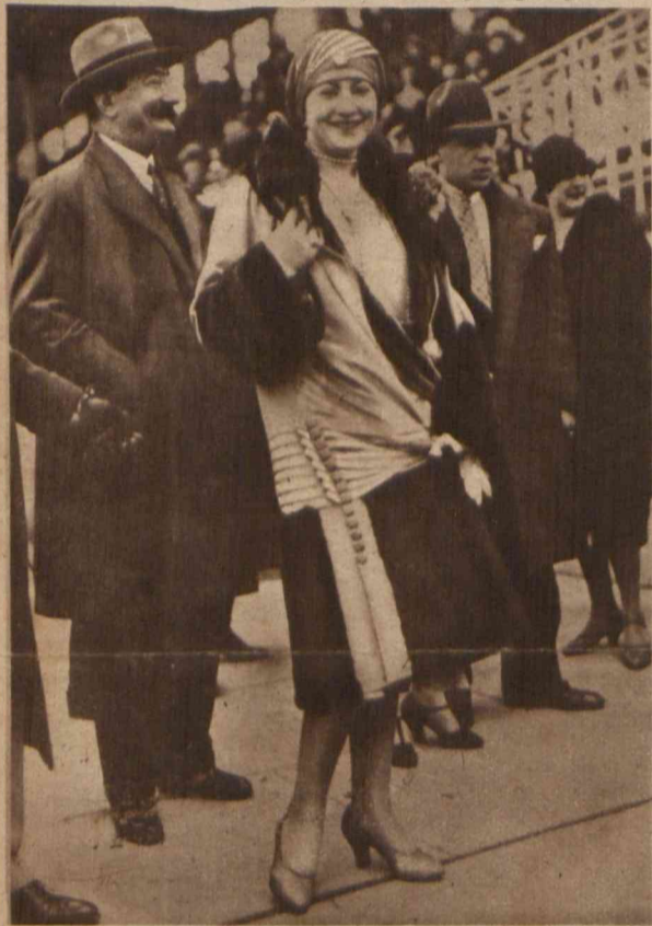
Sezon na Riwierze. Przegląd mód na wyścigach. Szary płaszcz okryty futrem, do tego kapelusz — turban.