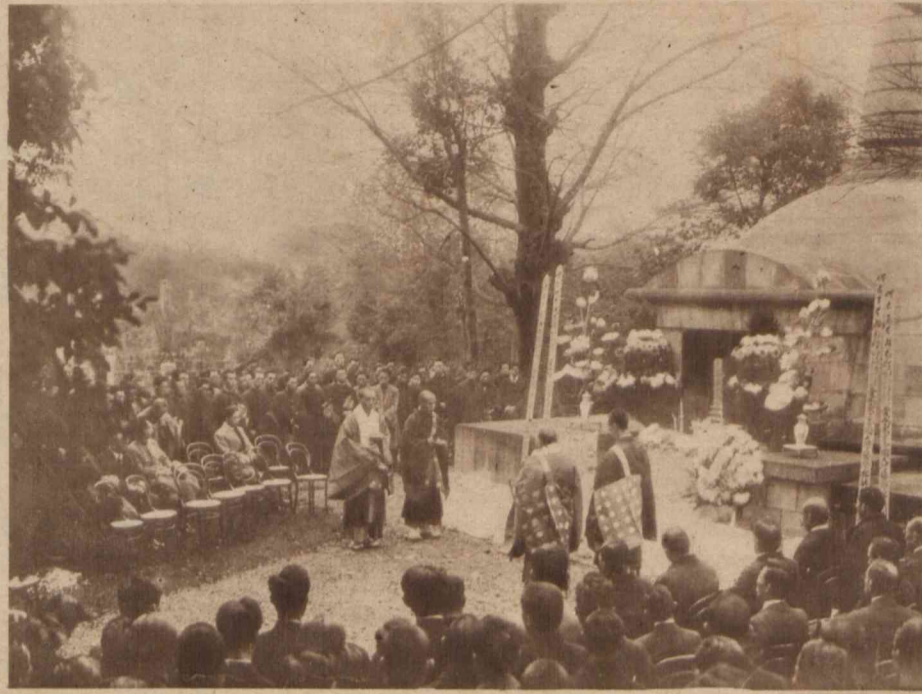
Uroczystości pogrzebowe profesora japońskiego, który ciało swe zapisał fakultetowi medycznemu w Tokio na cele anatomiczne.