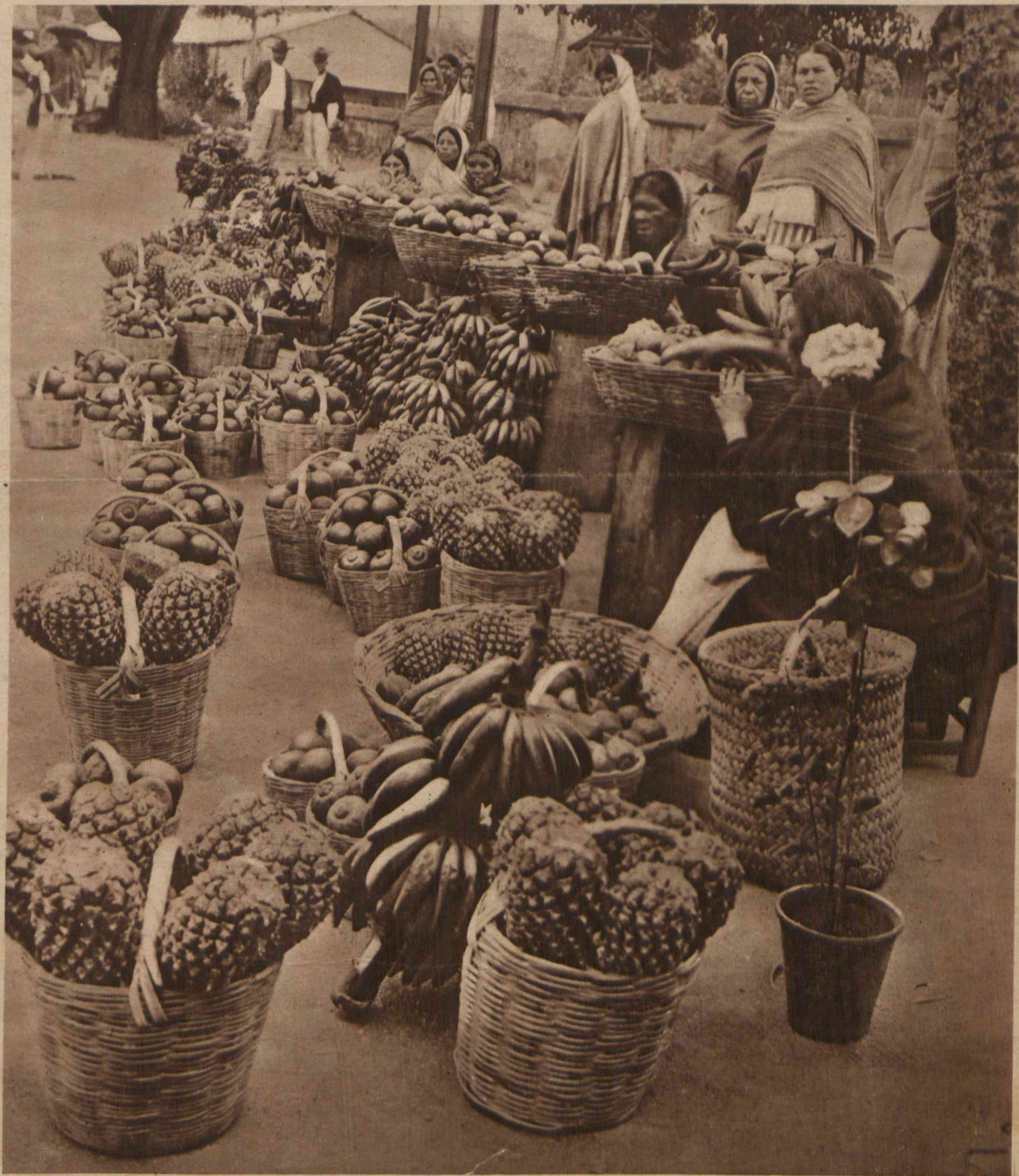
Meksyk, rajem — owoców południowych. Najwyszukańsze owoce sprzedaje się na targach ulicznych za bezcen. Scena z miasteczka Cordoba.