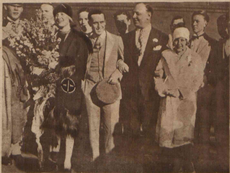
Artysta niemiecki Jannings w Hollywood. Od lewej: żona Janningsa Gussy Holl, Harold Lloyd, Jannings, żona Lloyd.