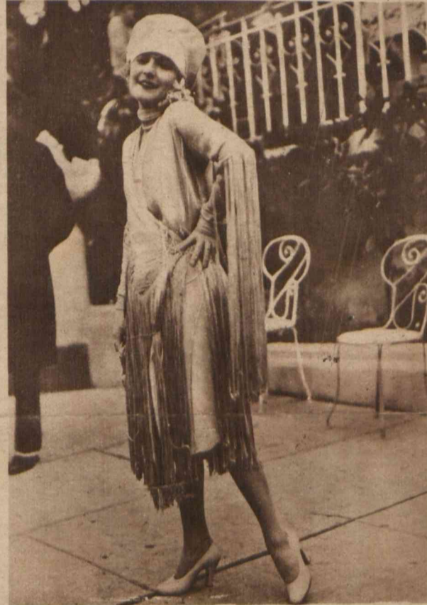
Sezon na Riwierze. Jasna suknia spacerowa ozdobiona frendzlami.