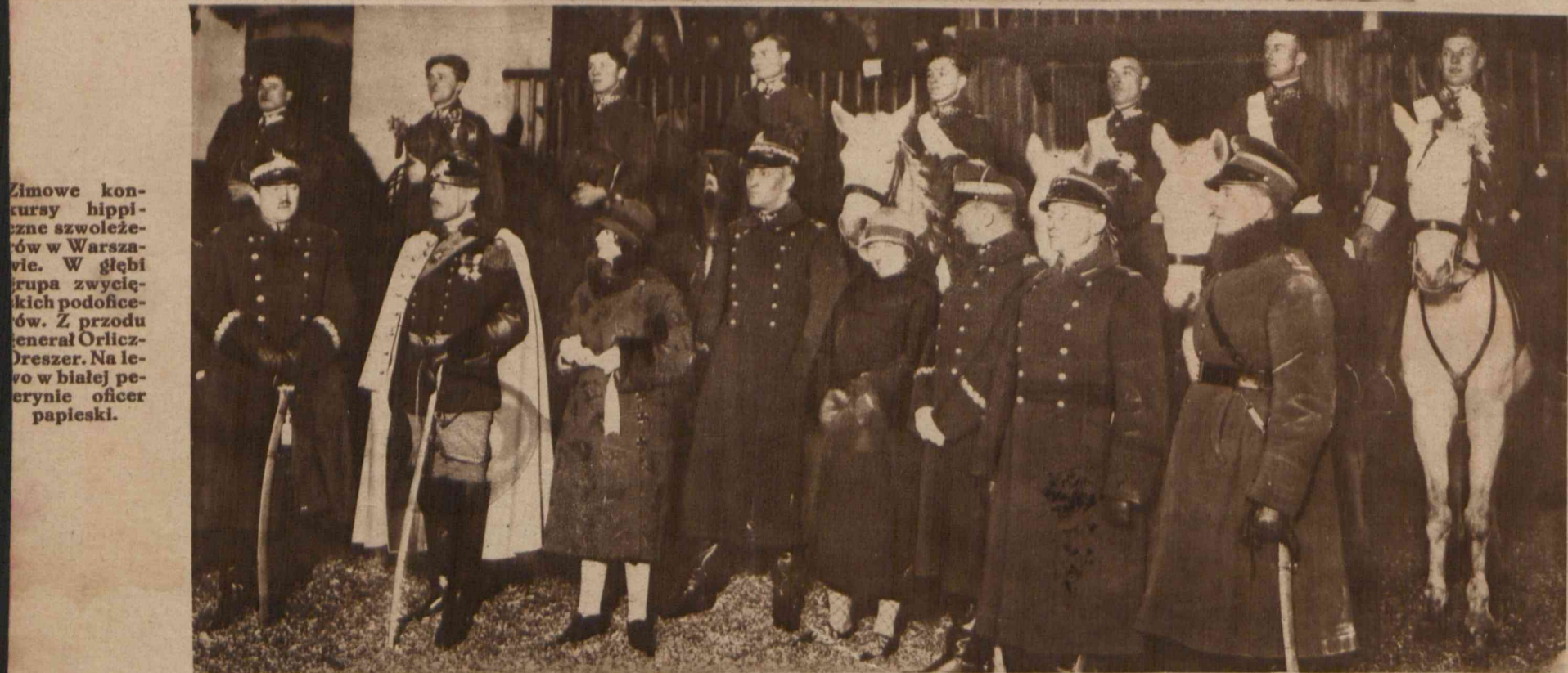
Zimowe konkursy hipiczne szwoleżców w Warszawie. W głębi grupa zwyciężczych podoficerców. Z przodu generał Orlicz-Dreszer. Na lewo w białej pelerynie oficer papieski.