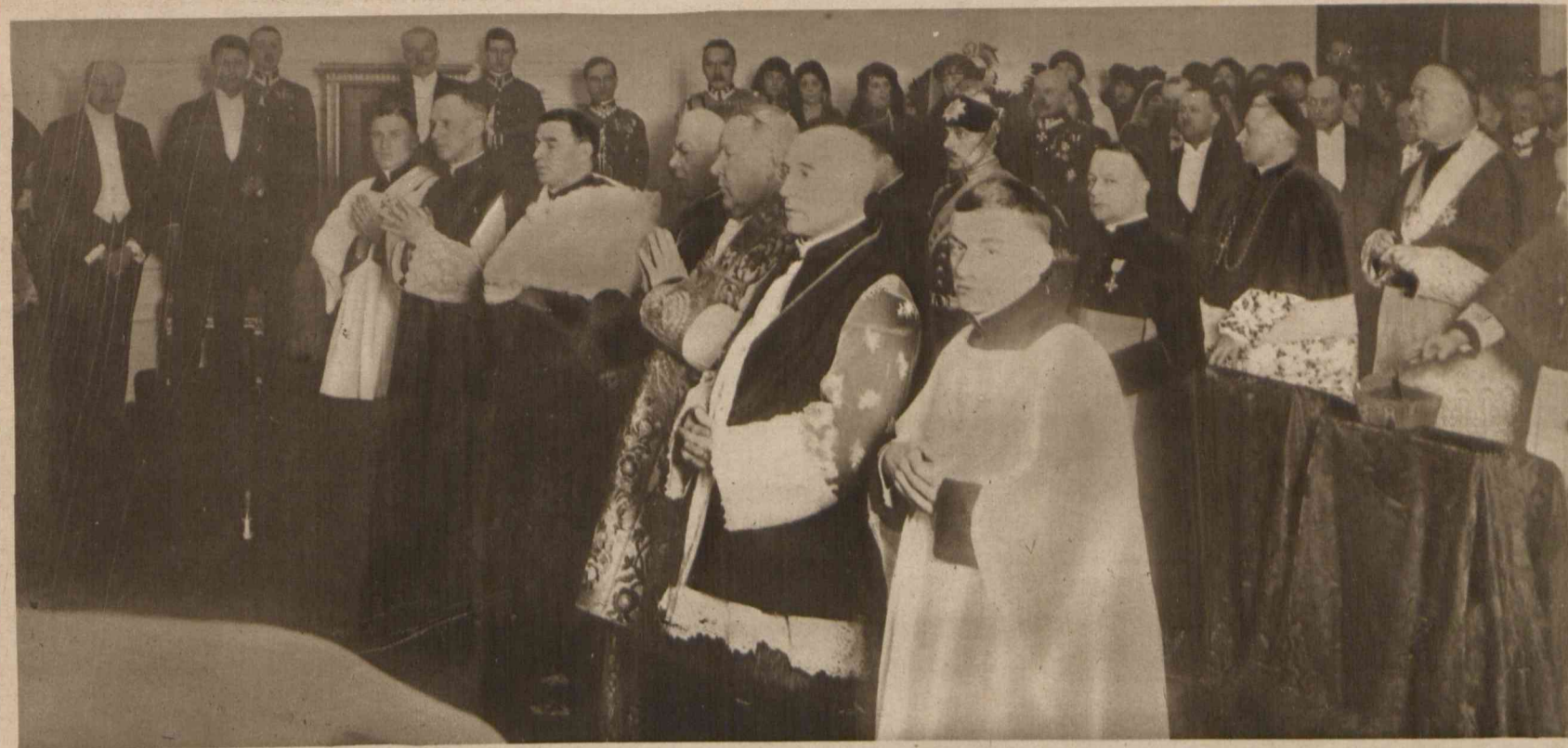
Uroczystość włożenia biretu kardynalskiego przez Prezydenta Rzeczypospolitej na głowę nuncjusza papieskiego Msgr. Lauriego, arcybiskupa efeskiego. Moment odśpiewywania „Te Deum laudamus”. W głębi na lewo widoczny p. prezydent Mościcki.