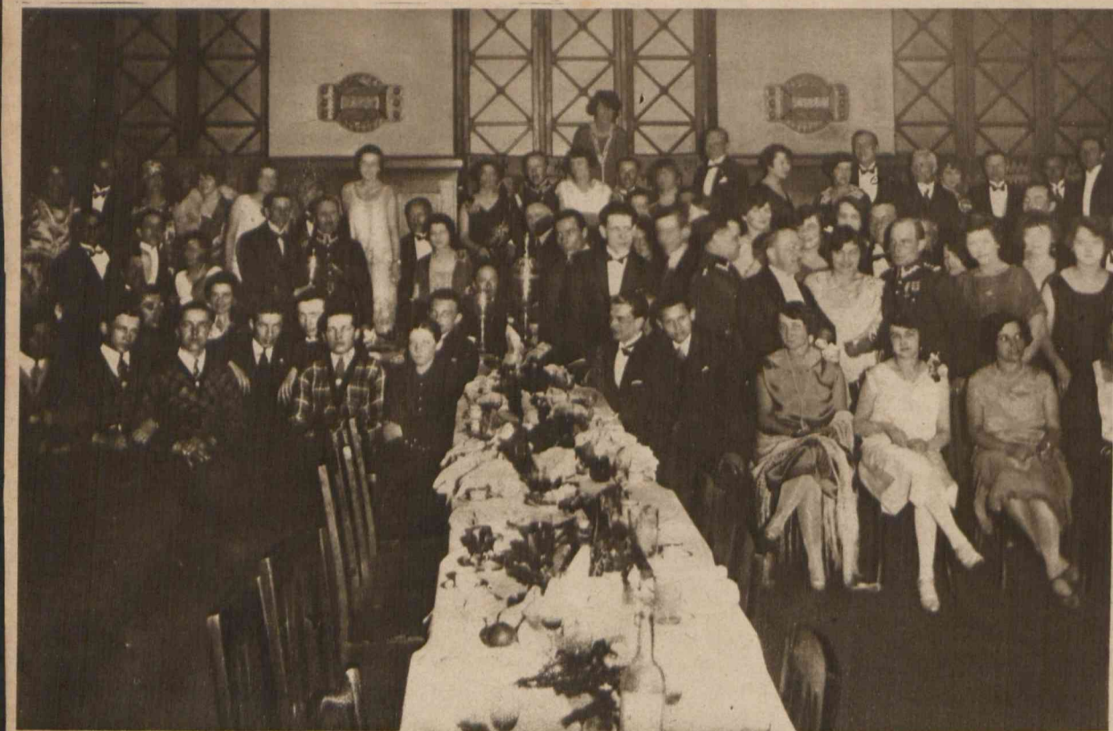
Z zawodów jubileuszowych Karpackiego Tow. Narciarzy we Lwowie. Uroczyste rozdanie nagród w salach Hotelu Krakowskiego zwycięskim zawodnikom.