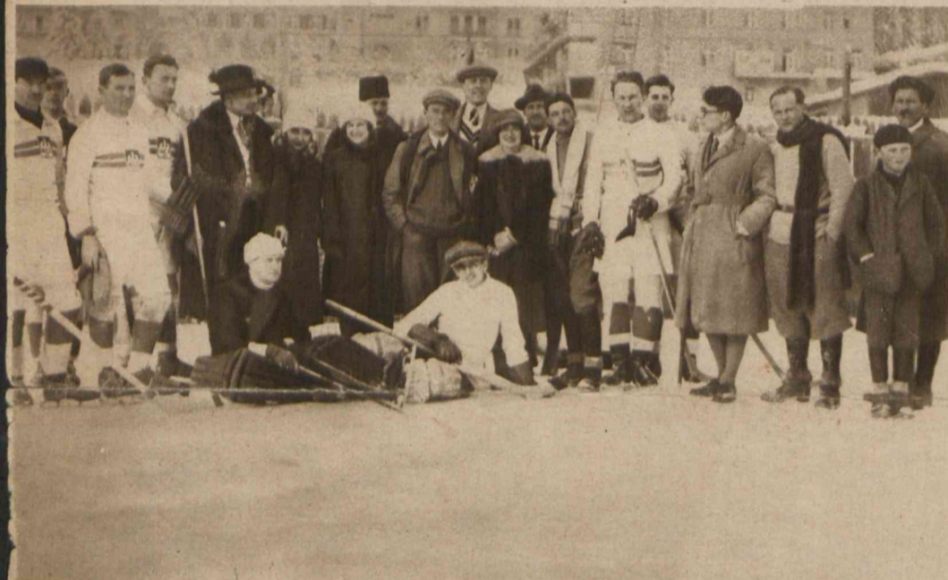
Z pobytu naszych hockeyistów w Davos. Gracze w otoczeniu kolonii polskiej.