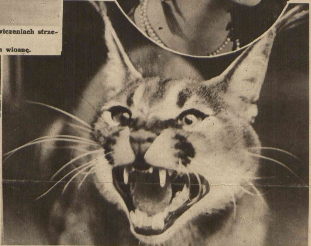
Interesujące zdjęcie rysia, który zdaje się nie być zbytnio zadowolony obecnością fotografa.