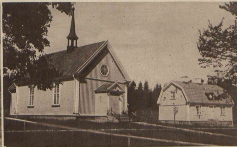
Z życia emigracji polskiej: Kościółek polski w Oskarström (Szwecja), gdzie zamieszkuje największa ilość Polaków. Na lewo: Oltarz w kościółku. Na prawo: Kościółek z plebanją.