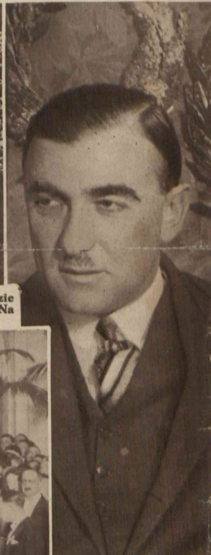
Nowy dyrektor państwowego konserwatorium muzycznego w Warszawie, znakomity kompozytor Karol Szymanowski.