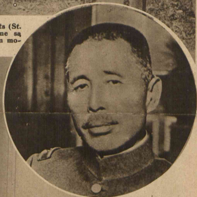
Kryzys rządu w Japonii. General Tanaka, który ma objąć kierownictwo gabinetu.