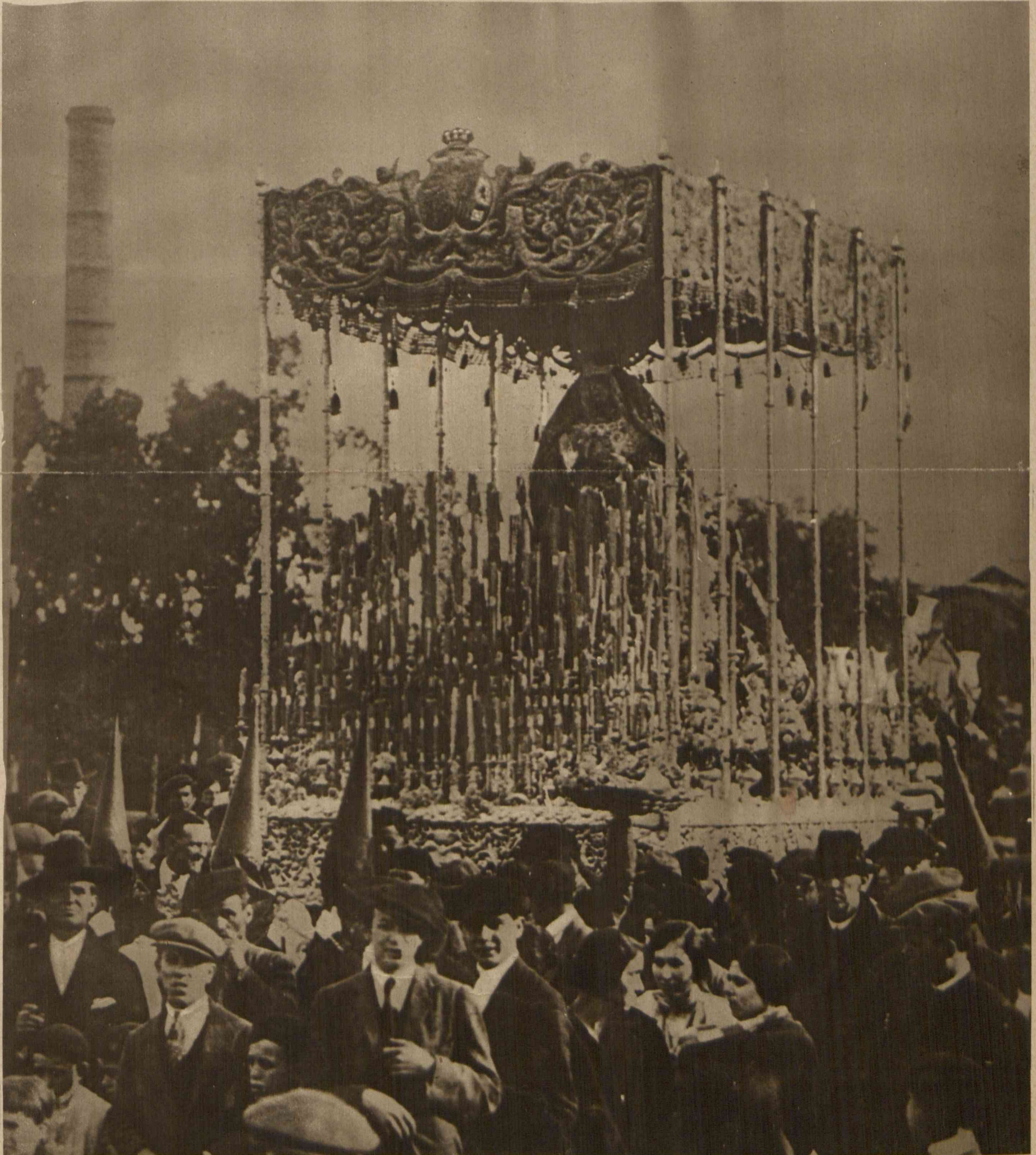
Semana Santa. Piękne miasto hiszpańskie Sewilla, słynne z pobożności, urządza z okazji Wielkiego Tygodnia, rozmaite uroczystości religijne, z których najważniejszą jest pochód przez miasto z cudownymi obrazami. Na uroczystość tę przyjeżdżają pobożni z całego świata.