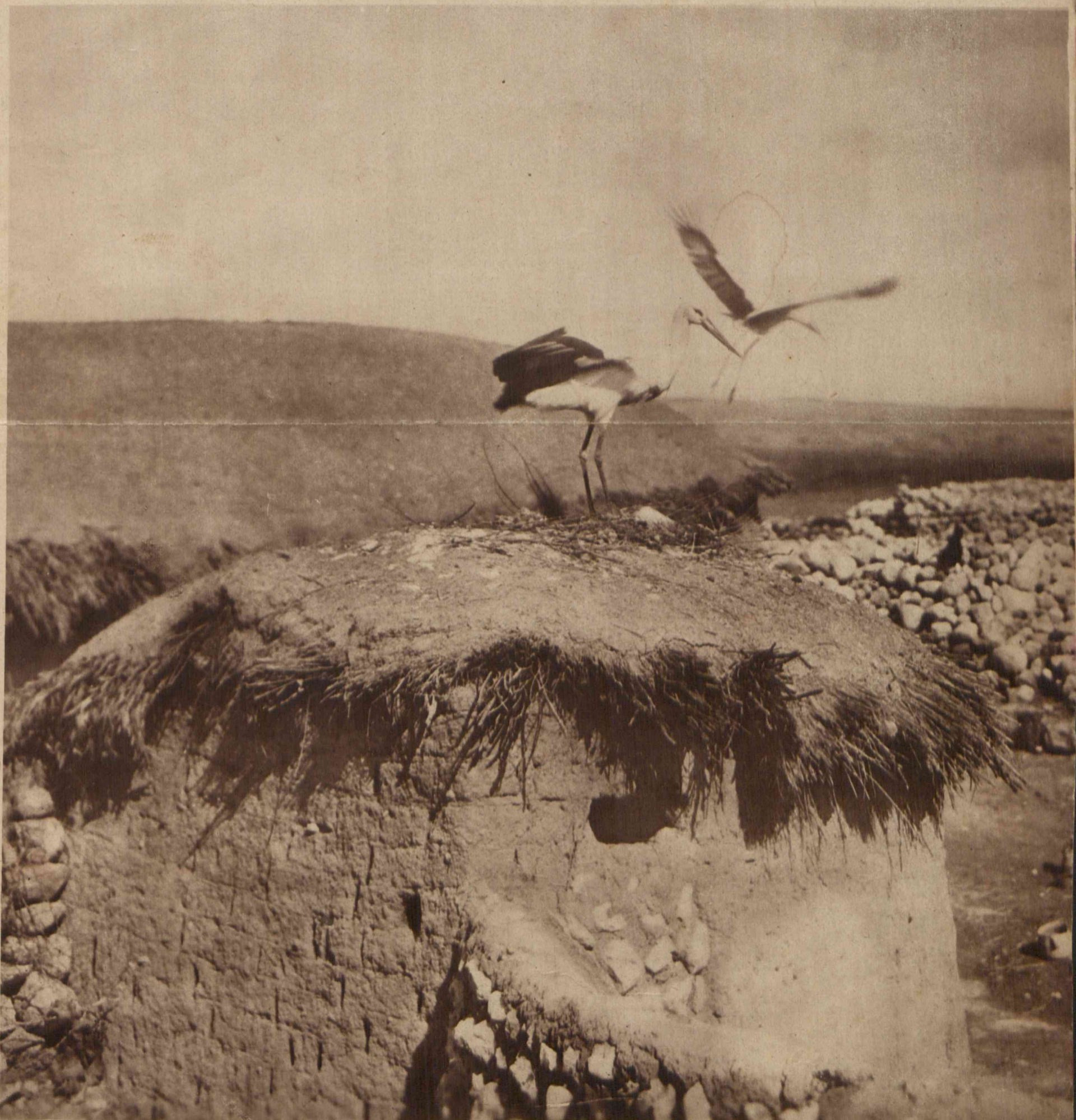
Bociany w Egipcie. Obrazek z Egiptu Górnego, z pobliza Asuanu, gdy nasze swojskie bociany porą wiosenną wybierają się w powrotną drogę do swej północnej ojczyzny.