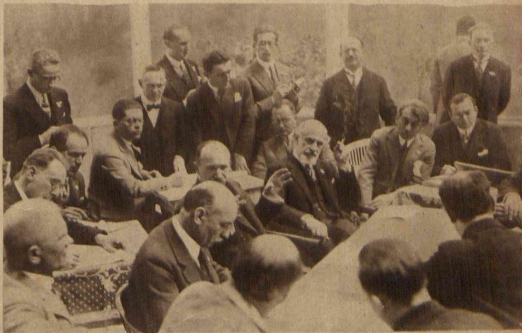
Konferencja Małej Entente'y w Jachymowie (Czechosłowacja). Na zdjęciu widoczni Markinković (Jugosławja), Benes (Czechosłowacja), Mitilneo (Rumunja).