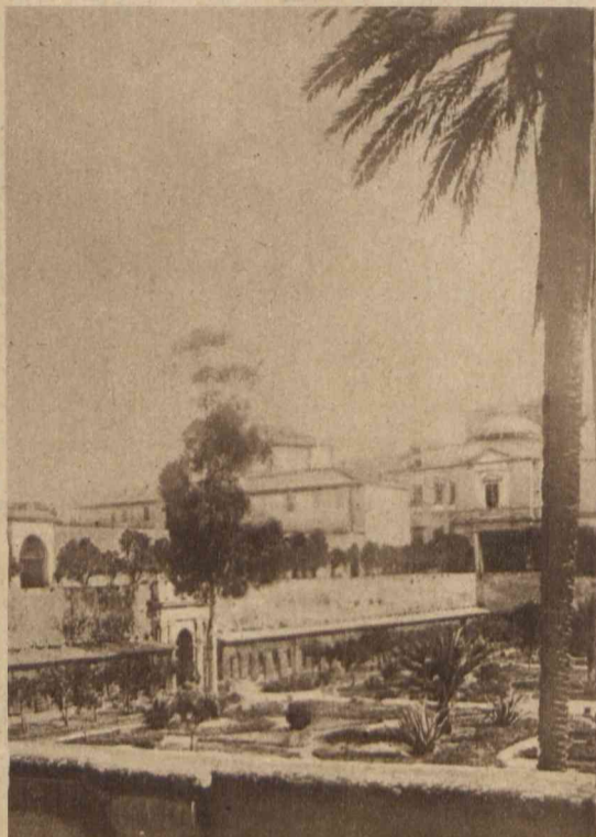
Z rezydencji papieskiej. Zdjęcia z Watykanu, będącego jedną z największych osobliwości Rzymu. Budowę rozpoczął w roku 1153 papież Eugeniusz III, dziś zabudowania liczą 11.000 ubikacyj. Na lewo malownicze zdjęcie pod światło wnętrza biblioteki. W środku ogród prywatny papieża. Na prawo: Wielka sala biblioteczna, którą wspaniałe freski i obrazy, czynią podobną do muzeum.