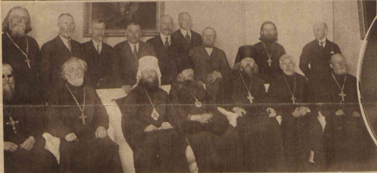
Posiedzenie Synodu Cerkwi prawosławnej w Polsce pod przewodnictwem metropolity Dyonizego.