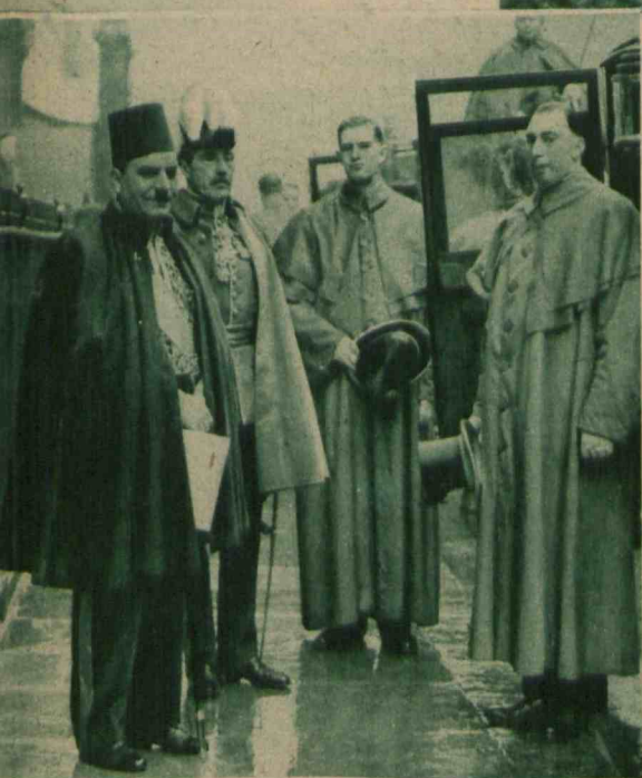
Dr Hafez Afifi Pasza, pierwszy poseł niezawisłego Egiptu, opuszcza pałac Buckingham w Londynie po złożeniu listów uwierzytelniających królowi Jerzemu. Aktem tym zadokumentowana została ostateczna niezależność Egiptu ze strony Imperium brytyjskiego.