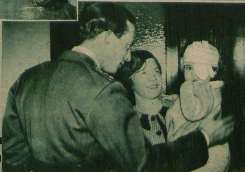
Obok na lewo — Król belgijski Leopold odwiedził w dniach ostatnich w szpitalu w Asnvers ofiary straszliwej eksplozji w Brasschaet.