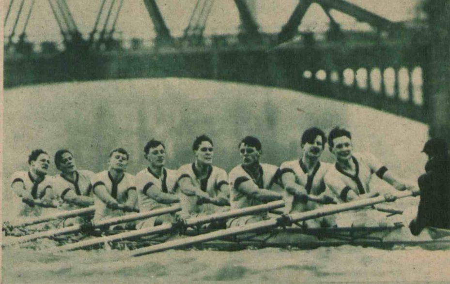
W tradycyjnych zawodach uniwersyteckich Oxford — Cambridge faworytem w tym roku stała się niespodzianie ósemka Oxfordu, wykazująca obecnie świeżą formę sportową.