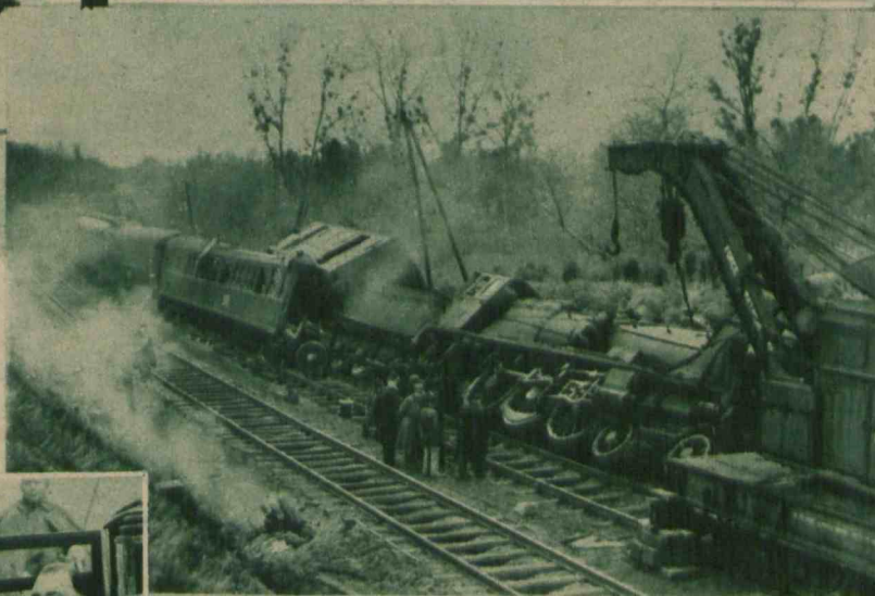
Na lewo — W okolicy Bourges we Francji zdarzyła się ostatnio straszna katastrofa pociągu ekspresowego, w której 13 osób straciło życie.