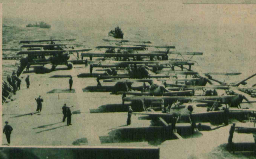
Imponujący widok eskadry bojowych samolotów angielskich, gotowych do startu z pokładu olbrzymiej „awionki”.