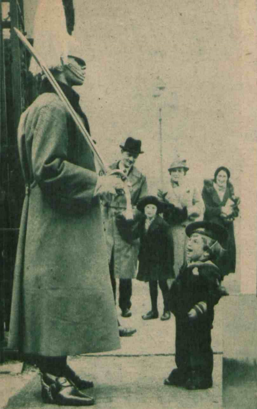
— Czy on jest prawdziwy?.. Małemu londyńczykowi nie może się jakoś pomieścić w główce, by ten nieruchomy, olbrzymi gwardzista przed Whitehall był żywym żołnierzem.