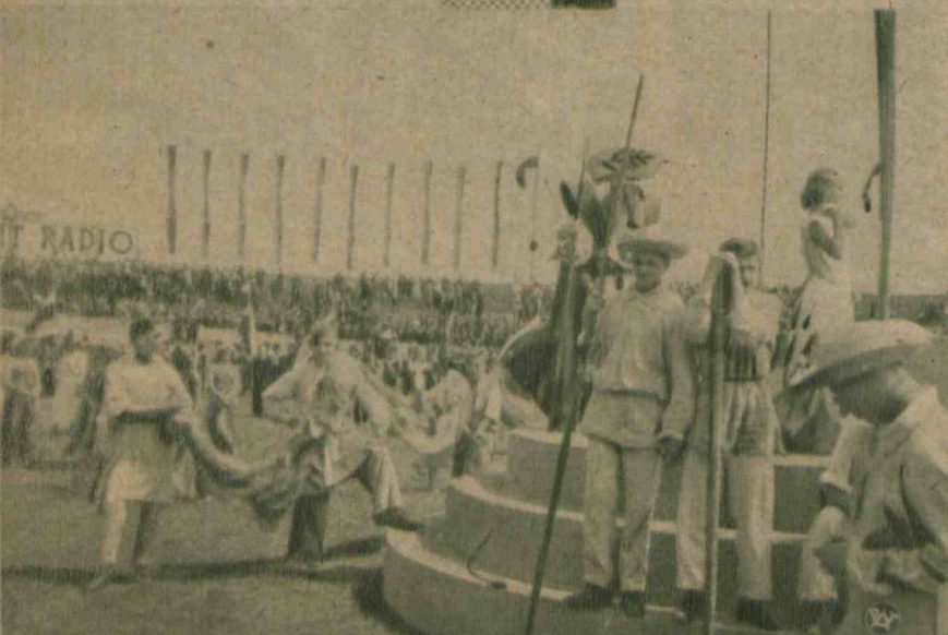
Symboliczna „Syrena” i flisacy wiślani w obrazie historycznym „Mieszko I-y”, odegranym w ub. niedzielę przez 1400 młodych artystów z warszawskich szkół miejskich.