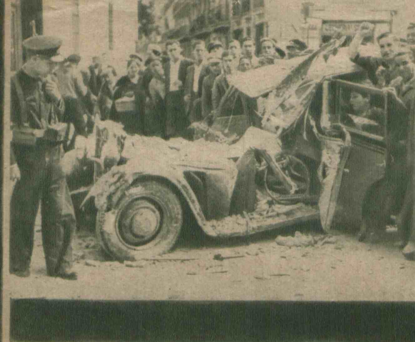
Na Valencję, siedzibę czerwonego rządu hiszpańskiego, pada bezustannie grad bomb rzuconych przez eskadry narodowe. Na zdjęciu samochód roztrzaskany bombą lotniczą.