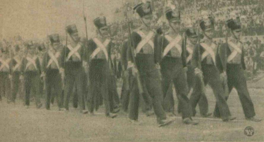
W ub. niedzielę młodzież szkół warszawskich, urządziła na Stadjonie Wojaka Polskiego gigantyczne widowisko „Z historii Warszawy”. Na zdjęciu fragment defilady w historycznych mundurach listopadowych.