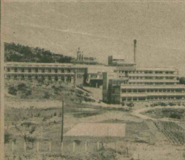
Wspaniały gmach sanatorium, zbudowany niedawno przez Towarzystwo Południowo-Mandżurskiej Kolei w pobliżu Dairen.