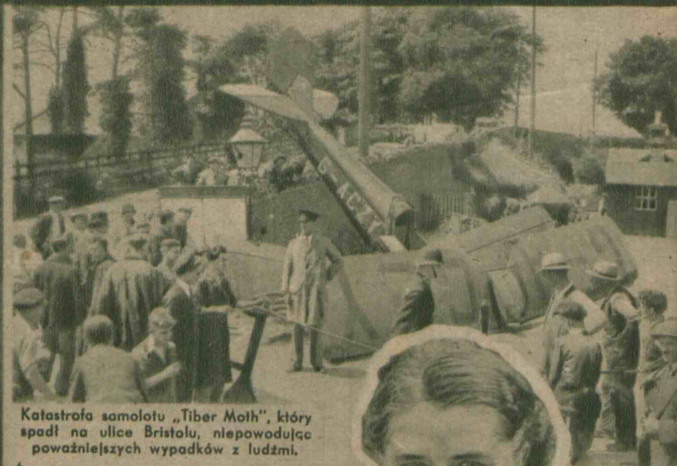
Katastrofa samolotu „Tiber Moth”, który spadł na ulice Bristolu, niepowodując poważniejszych wypadków z ludźmi.