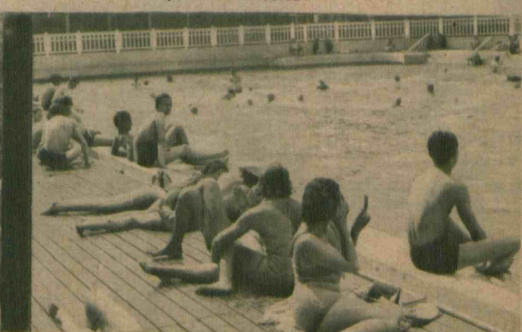
Oto obrazki z minionego na szczęście okresu upałów i suszy — na lewo gromadka dzieciaków, oblegająca kiosk z lodami, na prawo jedna z plaż paryskich w centrum miasta.