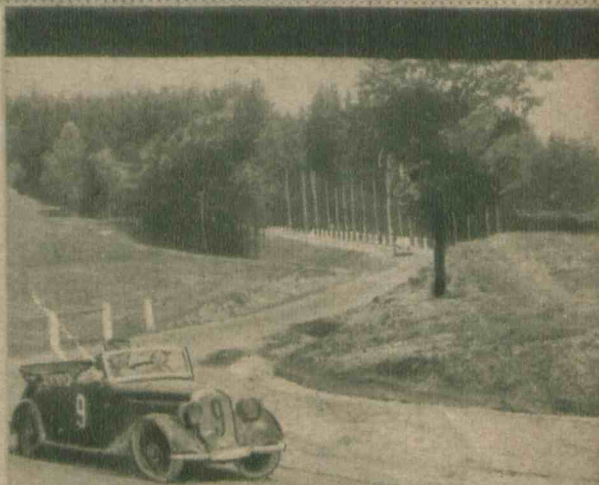
Zawodnik Rauch na niebezpiecznym wirażu na trasie 3-km. wyścigu górskiego na Równicy, w czasie tegorocznego raidu Automobil - Klubu Polski.