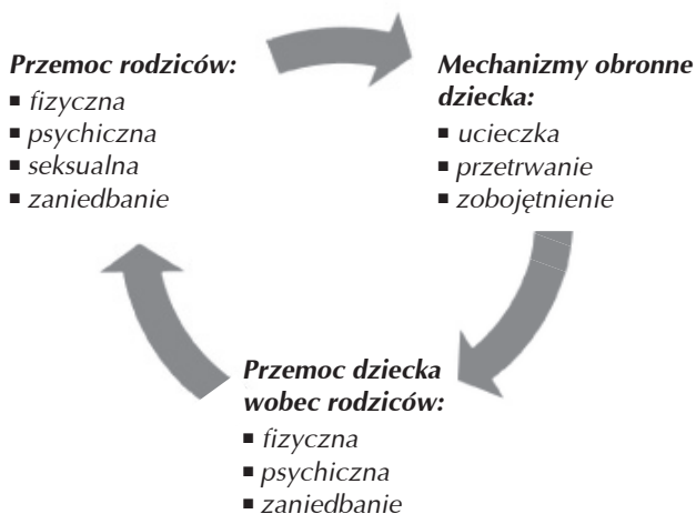
Schemat 2. Przemocowe interakcje rodzinne

Jak widać, mobbing rodzinny niesie ze sobą określone skutki w postawach dziecka. Drugi schemat pokazuje określone zachowania rodziców i dzieci w kontekście przemocy. W konsekwencji w wielu przypadkach dochodzi do powielenia pewnych zachowań także w szkole.