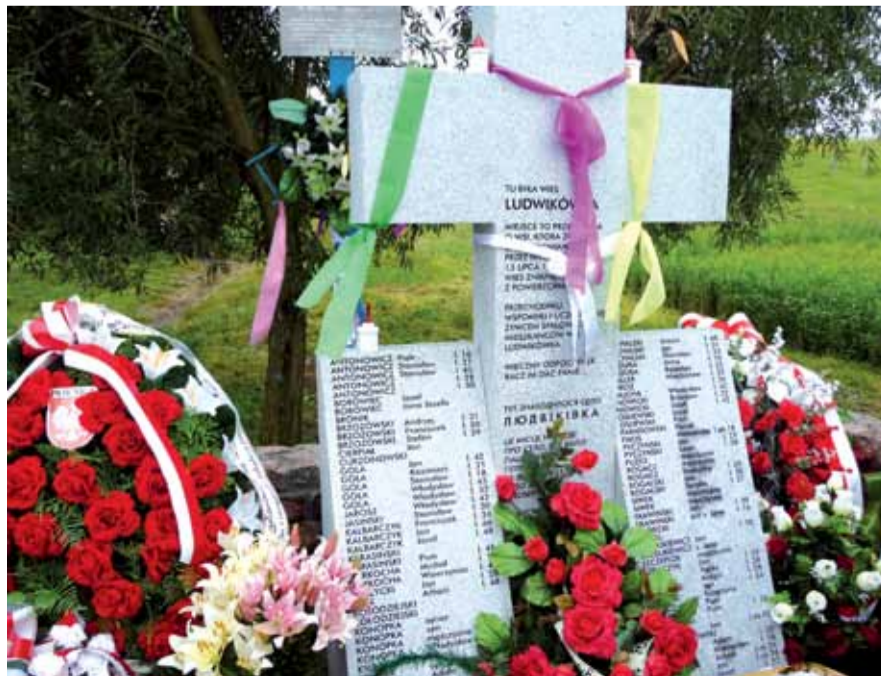
Krzyż Ludwikówki Хрест Людвікувки

Ponieważ stan krzyża wskazywał na rychły jego rozpad, powstał pomysł aby postawić trwały kamienny krzyż, z dotychczasowym napisem, uzupełnionym o imienną listę ofiar. Po powrocie do kraju rozpoczęto intensywne działania w celu realizacji trwałego upamiętnienia kolonii Ludwikówka i tragedii jej mieszkańców. Odnaleziono ludzi