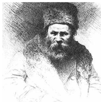
TARAS SZEWCZENKO KOBZIARZ

Український мовний літературний початок од „Eneidy” Iwana Kotlarewskiego, która została opublikowana w dalekim 1798 roku w Petersburgu. Ta trawestacja „Eneidy” Wergiliusza była napisana żywym językiem zbliżonym do mowy ludu ukraińskiego. A już w 1840 roku Taras Szewczenko swoim „Kobziarem», także wydanym w Petersburgu, ustalił język, który do tej pory prawie nie zmienił się. Ukraińcy do dziś korzystają z języka, którym pisali swoje słynne utwory genialni klasycy.