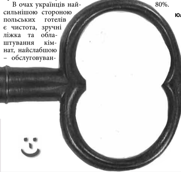
Napis na drzwiach hotelowych: Pukanie zepsute - proszę dzwonić.

Do hotelu w Warszawie przyjeżdża Hiszpan. Recepcjonista pyta: - Pańskie nazwisko? - Enrico Dela Toscana Mia Angela Papanella. - Och, żałuję, ale możemy wynająć pokój tylko dla jednej osoby.