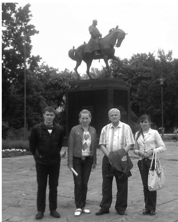
Переможці вікторини та автор статті у Любліні біля пам'ятника Маршалку Юзефу Пілсудському

przez Konsulat Generalny RP w Łucku w związku z 200-leciem urodzin wybitnego polskiego poety, którego rodzinnym miastem