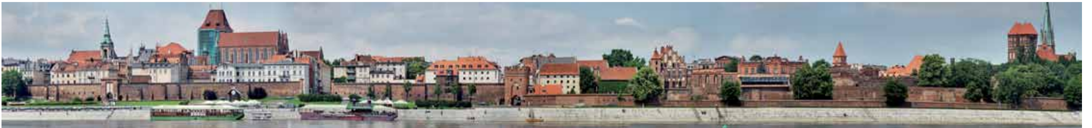
Panorama Torunia.