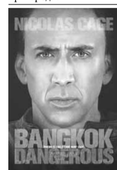
21.15 Х/ф "Небезпечний Бангкок". 1+1