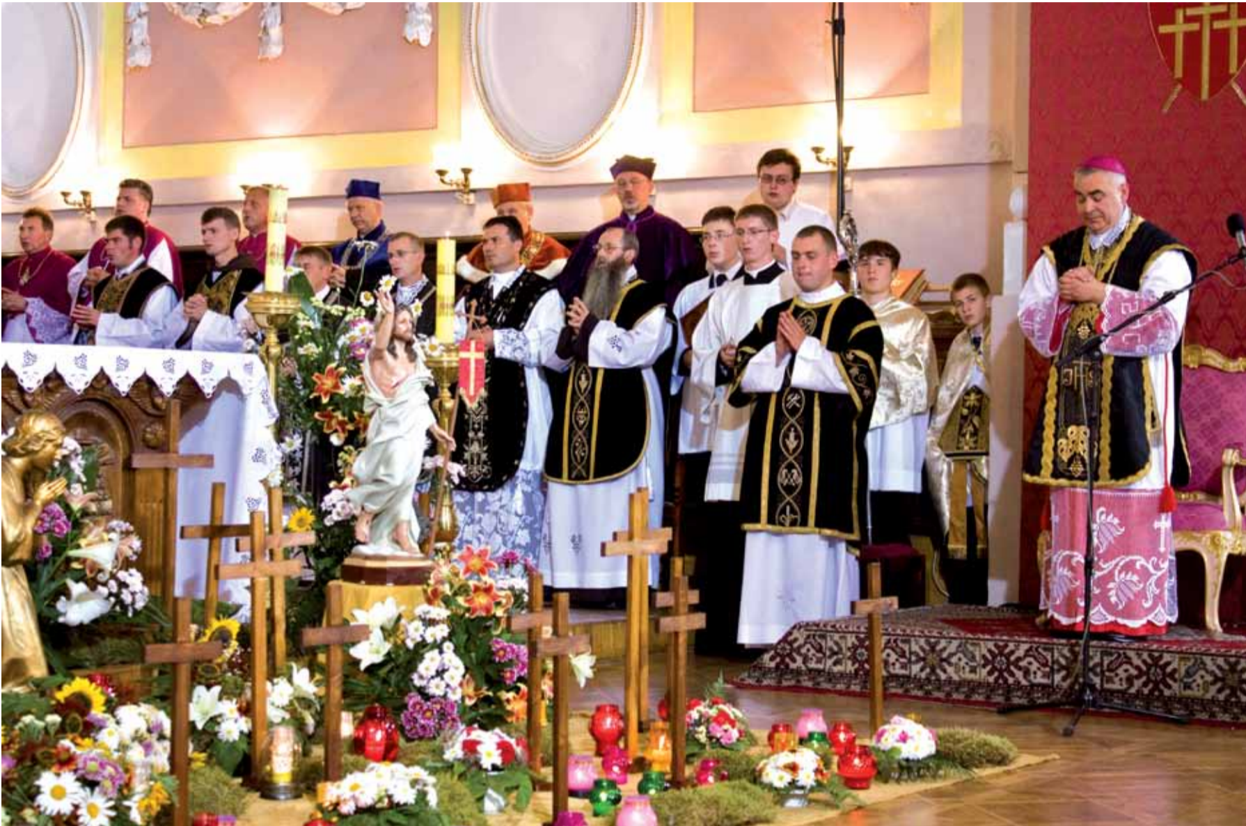
Msza św. w katedrze łuckiej pw św. Apostołów Piotra i Pawła. Свята Літургія у луцькій катедрі св. Апостолів Петра і Павла.

W Łucku 12 lipca w katedrze pw św. Apostołów Piotra i Pawła z udziałem kilkuset wiernych z Polski i Ukrainy odprawiono Mszę św. z okazji 66 rocznicy tragedii wołyńskiej.