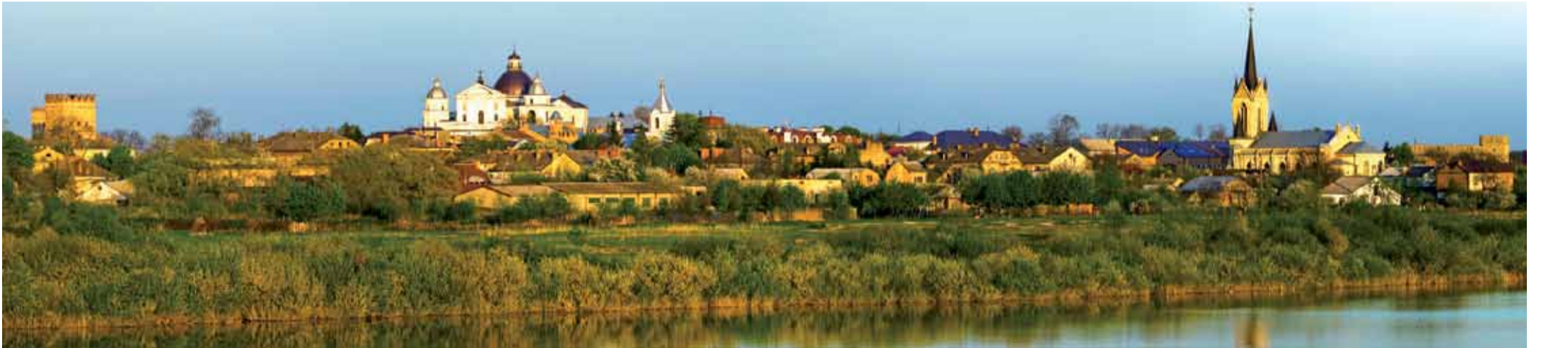
Panorama Łucka.