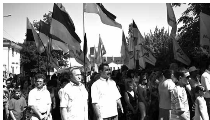
Łucki majdan 2009 Луцький майдан 2009