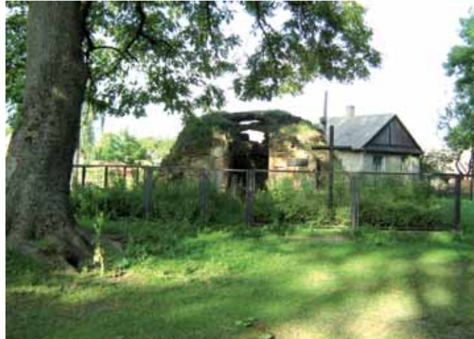
Grobowiec hrabiów Worcellów

uchronili całego tego bogactwa. Zamek został zrujnowany w XVIII wieku. Przypominają o nim jedynie resztki ściany i podziemia, do których rzekł dawno już nikt nie schodził.