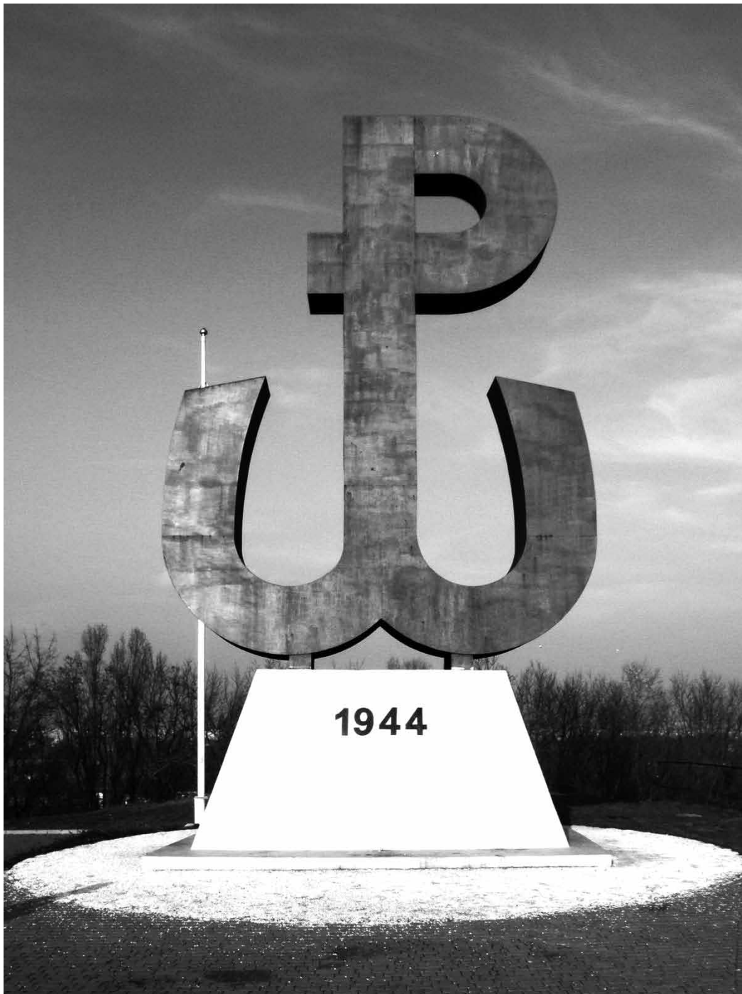
Znak Polski Walczącej

W tragicznych dniach powstania warszawskiego po stronie polskiej zginęło od 120 do 200 tysięcy mieszkańców stolicy. Do tego należy dodać straty wśród żołnierzy - około 10 tys. zabitych, 7 tys. zaginionych i 5 tys. rannych. Wśród zabitych