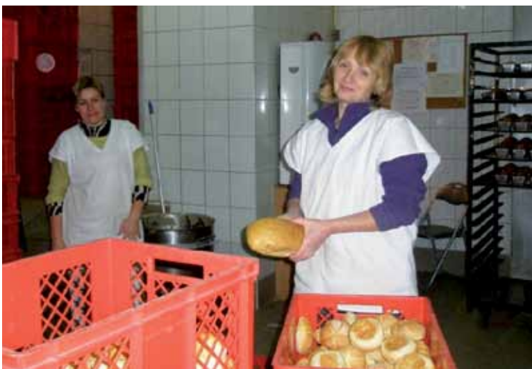
Mieszkancki Kowla i rejonu Włodzimierz Wołyńskiego. Praca w piekarni. Mешканки м. Ковеля та Володимир-Волинського району. Робота на пекарні.

Światowy kryzys finansowy nie ominął także rynku