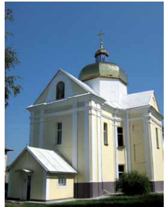
Cerkiew p.w. Św. Mikołaja

На жаль, ні час, ні люди не зберегли усього цього багатства. Замок був зруйнований у XVIII ст. Рештки стіни та підземний хід, яким уже давно ніхто не хо-