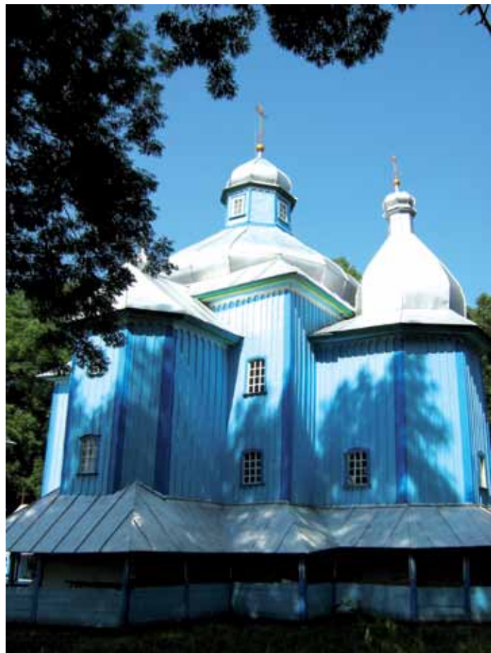
Cerkiew p.w. Św. Trójcy