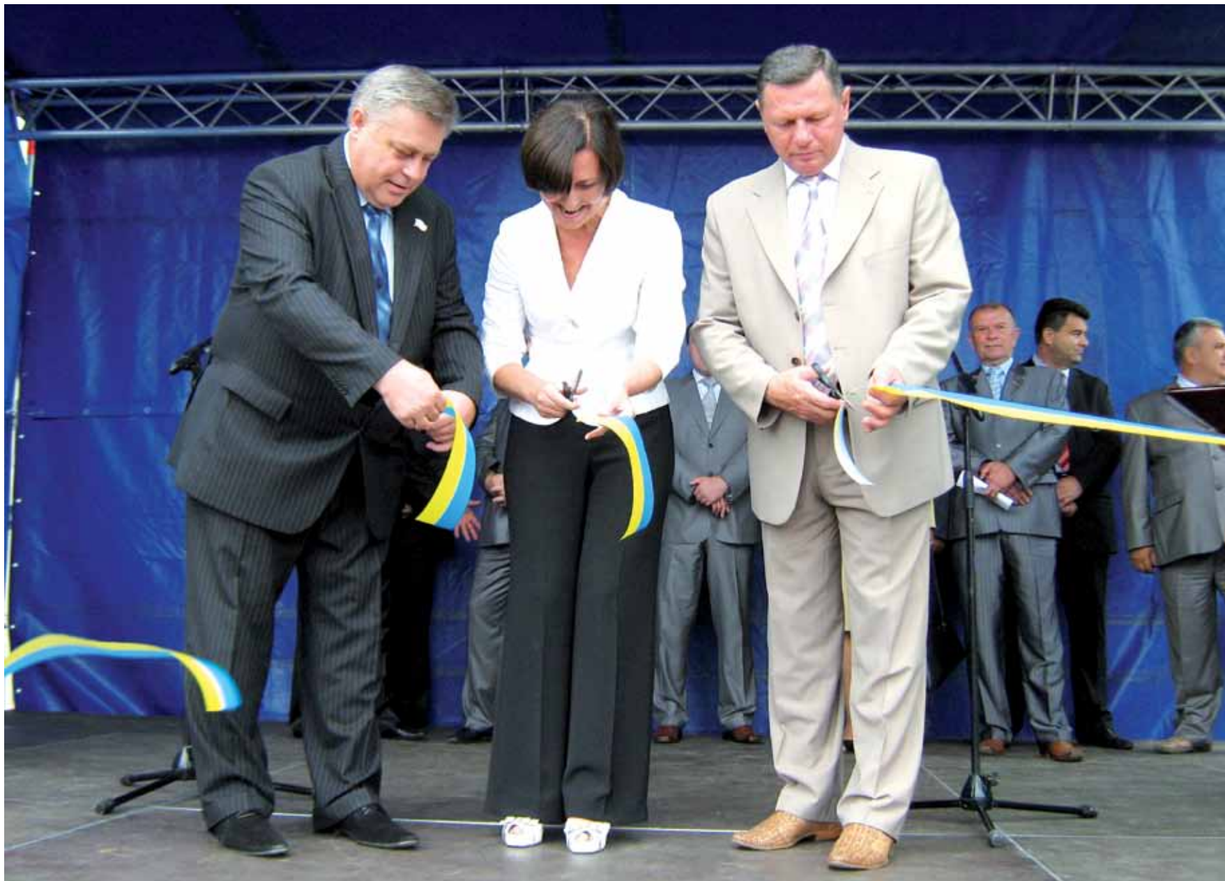
Відкриття виставки-ярмарку „Волинь-Агро 2009”.

4-5 września w Łucku w ramach II Wołyńskiego forum inwestycyjnego odbyły się Targi Międzynarodowe „Wołyń-Agro 2009”.