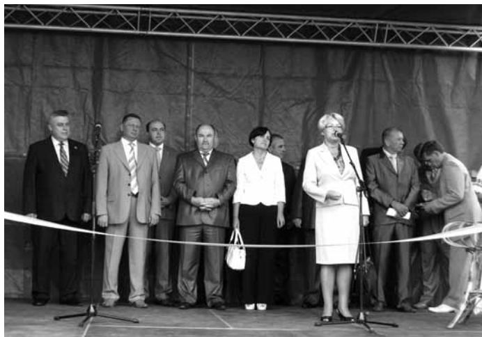
Привітання учасників виставки „Волинь-Агро 2009”

W ramach forum inwestycyjnego Cisco System International B.V., Wołyńska Obwodowa Ad-