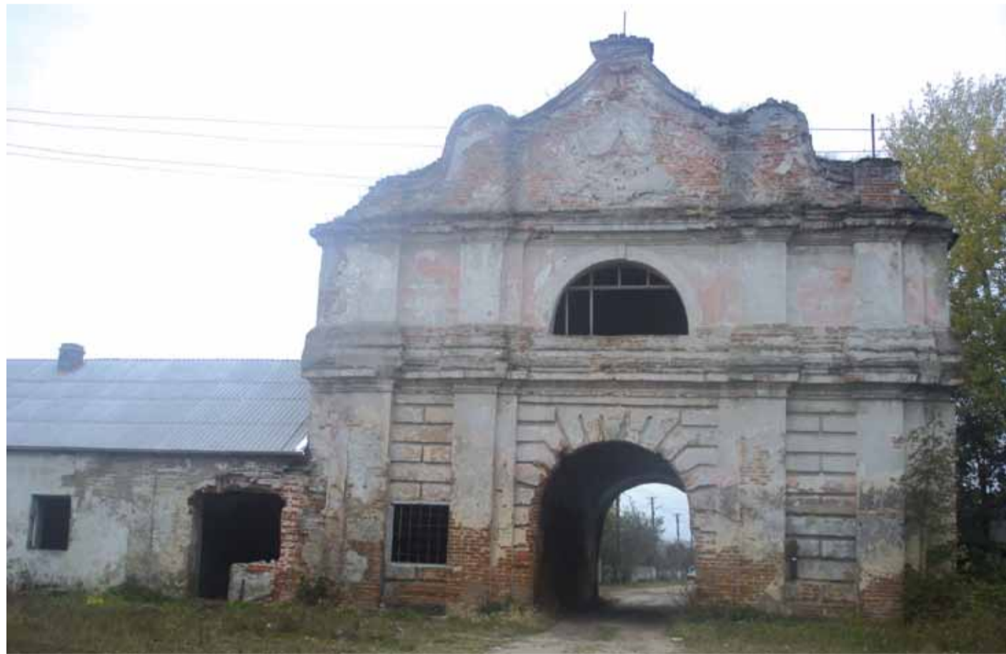
Брама вjazdowa до Zamku Czarnieckiego