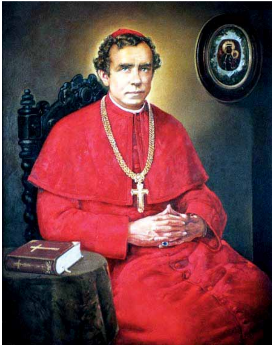
Zygmunt Szczęсны Feliński

Opinie te dotarły do Watykanu i w styczniu 1862 r. papież Pius IX mianował Felińskiego arcybiskupem metropolitą warszawskim. Niestety na stanowisku metropolity był przez wielu niezrozumiany, początkowo postrzegany jako człowiek cara. Mimo to z wielką gorliwością zajął się odrodzeniem duchowym archidiecezji – zreformował seminaria i Akademię Duchowną w Warszawie, założył schronisko dla biednych dzieci, zwołał zjazd duchowieństwa.