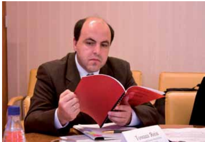
Генеральний консул РП у Луцьку Томаш Янік.

Появилися такі певні пільги – зокрема, деякі категорії осіб можуть отримати безкоштовно візу на короткі подорожі (до 90 днів), котрі не є пов'язаними з трудовою діяльністю. В зв'язку з цим кількість безкоштовних виз збільшилася в порівнянні до 2008 року. Наразі головна причина відмов полягає в тому, що Консулат видає негативні рішення щодо оформлення візових документів. Крім того, що угода вступила в силу півтора року тому, втім багато осіб не знають про її існування і в зв'язку з цим не подають документи на отримання виз. Ситуація в Луцьку, однак, цілком позитивна. Зайняті питаннями оформлення виз можуть знайти необхідну інформацію на сторінці Інтернет-платформи ( luckkg.polemb.net ), на табличках оголошень перед Консулатом та в віконцях інформаційних. Як зазначив Консул Томаш Янік – процедура оформлення виз в Консулаті Польщі в Луцьку суттєво спрощена. Крім того, що Консулат видає рішення щодо оформлення виз протягом короткого часу, втім багато осіб не знають про її існування і в зв'язку з цим не подають документи на отримання виз. Ситуація в Луцьку, однак, цілком позитивна. Зайняті питаннями оформлення виз можуть знайти необхідну інформацію на сторінці Інтернет-платформи ( luckkg.polemb.net ), на табличках оголошень перед Консулатом та в віконцях інформаційних.