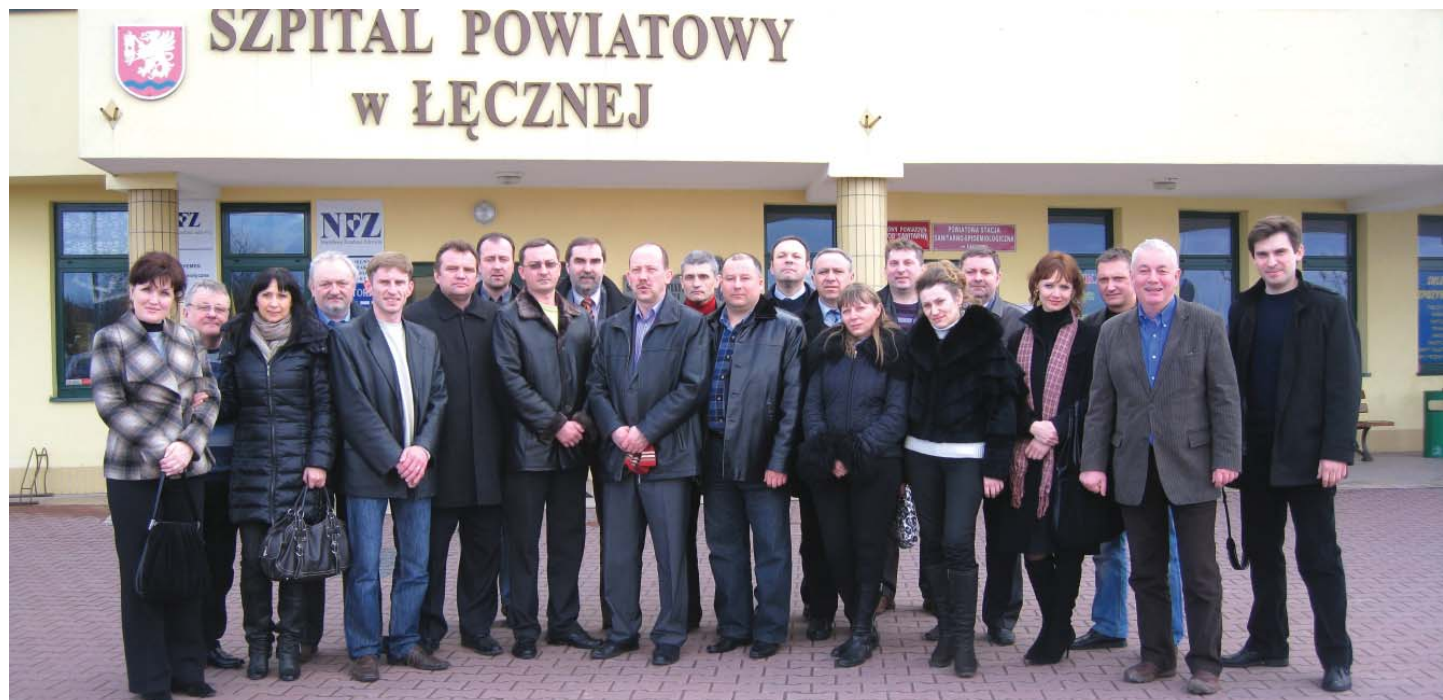
Коло лікарів із Луцька у Ленчній (Польща)

Група волинських лікарів з 24 по 26 березня нинішнього року на запрошення фонду „Pro Bono Futuro” відвідала ряд медичних закладів та урядових установ у Любліні та Хелмі. Програма візиту була досить насиченою. Серед закладів, який лікарі відвідали у рамках візиту, був Самостійний воєводський шпиталь у місті Хелмі. За останні десять років, відколи у Польщі пройшла реформа у системі охорони здоров'я, цей заклад у великому місті став сучасною лікарнею, що відповідає європейським стандартам. Палати розраховані на одне-