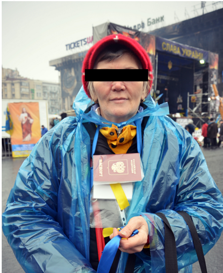
Через порушення прав людини у Росії, редакція Волинського монітора зобов'язана оберігати анонімність особи зображеної на світліні.