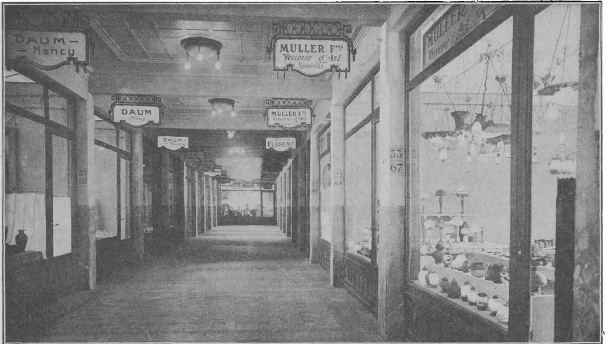
Palaco de la Lyon'a Foiro — Galerio en la Grupo de Artaj Artikloj.

Al ĉiu petonto, la Foiro de Lyon sendos dokumentaron eldonitan tute en Esperanto, entenantan: