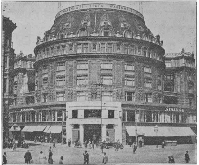
Stafa Magazeno, Mariahilferstrasse 120, Wien.

subtenas la E-movadon. Dank'al la penado de S-ro R. M. Frey, Kalkulkonsilanto, tiu ĉi grandega magazeno en Vieno aranĝis kurson de Esperanto por la publiko. La firmo aliĝis al UEA kiel entrepreno kaj montras multan intereson al nia afero.