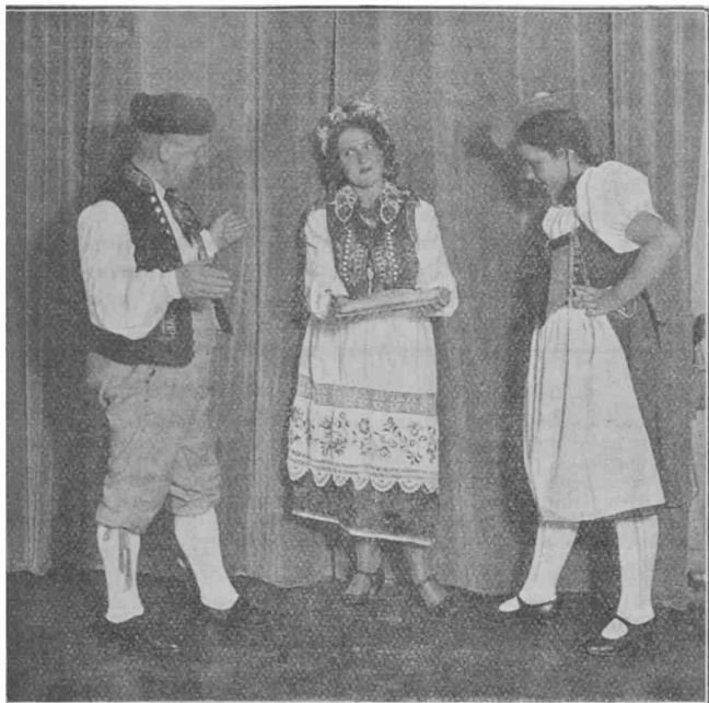
Cefoslovako, polino, svicino en naciaj kostumoj.

jubilea de Esperanto 1933 kaj kondukis la rigardantojn al la venontjara kongresurbo per filmo, montranta la belecojn de la rejna metropolo kaj ĝia ĉirkaŭaĵo. Oni videble ĝojis pri tiu vigla propagando — reale montrigis tiu danko en 100 aliĝoj por la 25a !