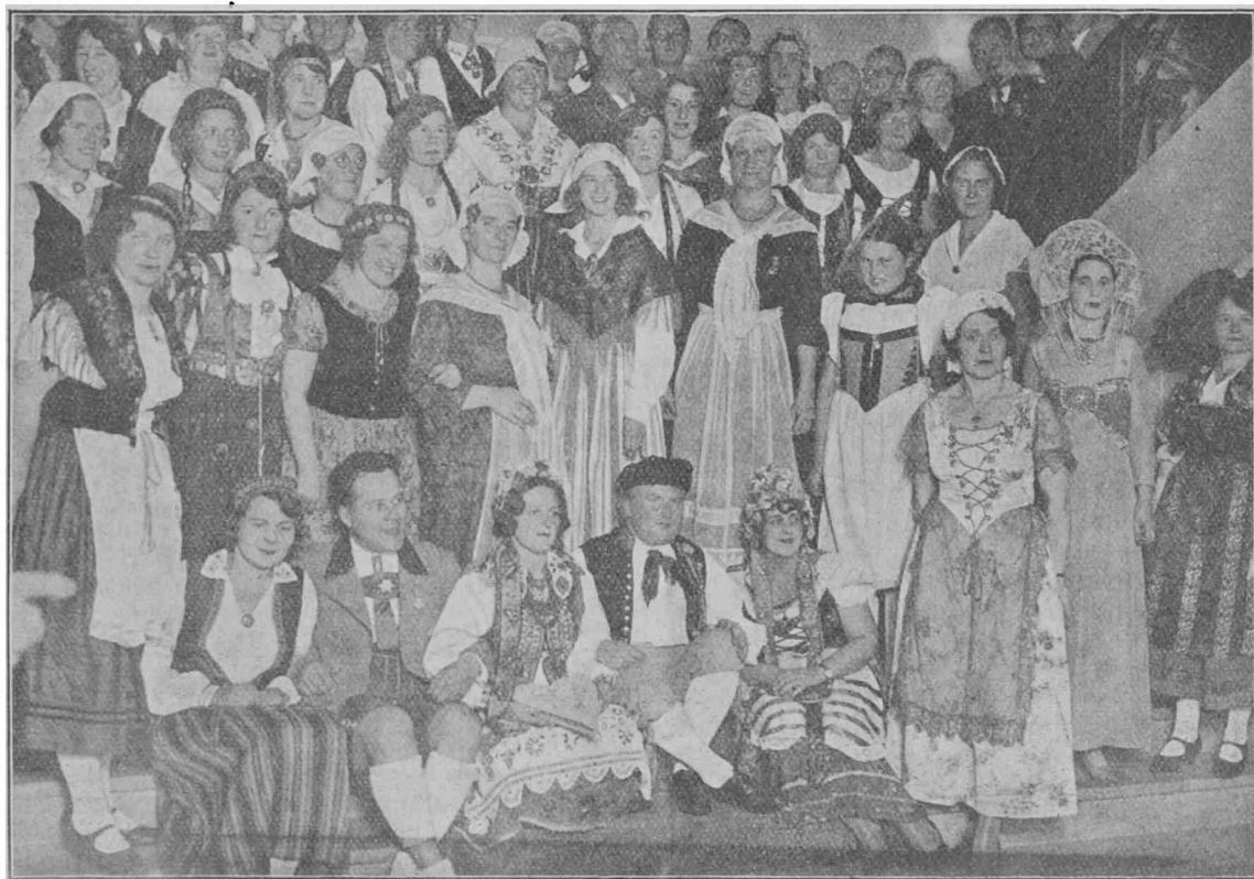
Grupo kun naciaj kostumoj.