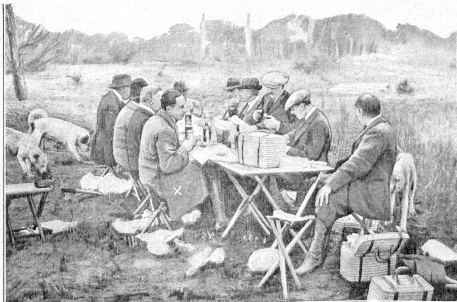
Król Alfons hiszpański (x) przy śniadaniu ze swymi gośćmi na polowaniu pod Sewillą.