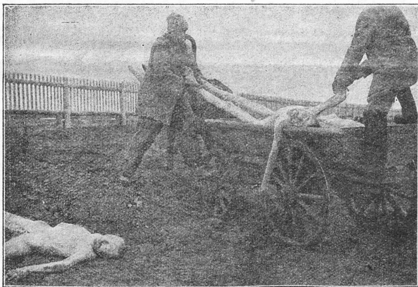
La forigo de la mortintoj.

Antaŭ ĉi tiu vorto: „forĵuro“, ili hezitas antaŭenmarŝi. Ĉu la eklezia leĝaro, ĝis nun aplikata, ne povas esti plilarge komprenata? Ĉu kredokonfeso simila al tiu farita de Solovjev ne sufiĉas? Ne apartenas al mi respondi, sed mi opinias ke la