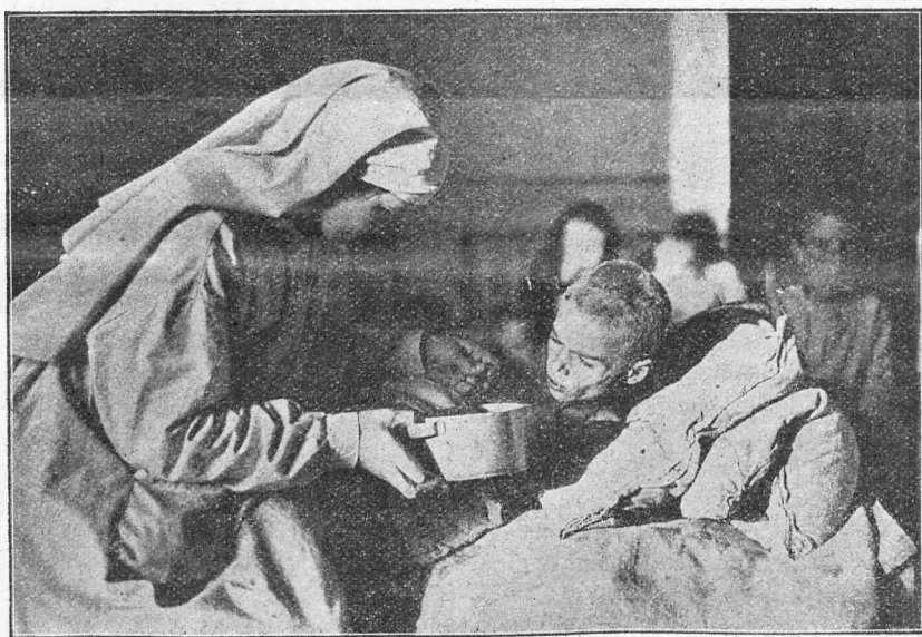
La kristana karito en Ruslando.

Jes la rusa animo estas malsana! La korpa malsato finiĝos. La anima malsano tamen daŭras, daŭros dum multaj dekjaroj. Ĉu la okcidento fine komencos kompreni