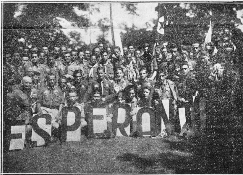
ESPERANTIRTAJ SKOLTOJ ĈE LA BUDAPEŝTA JAMBOREO

garujo, kune kun la kreinto de la Institucio, Lordo Baden-Powell eniras la kampon rajdante sur belaj ĉevaloj. La du ĉefuloj salutas la skoltaron tie kunigitaj. En tiuj emociplenaj momentoj, miloj da kolomboj estis liberigataj, kaj dum momento ili flugas nube malaperante en malproksimecon. Oni spiradas pacon kaj komprenemon.