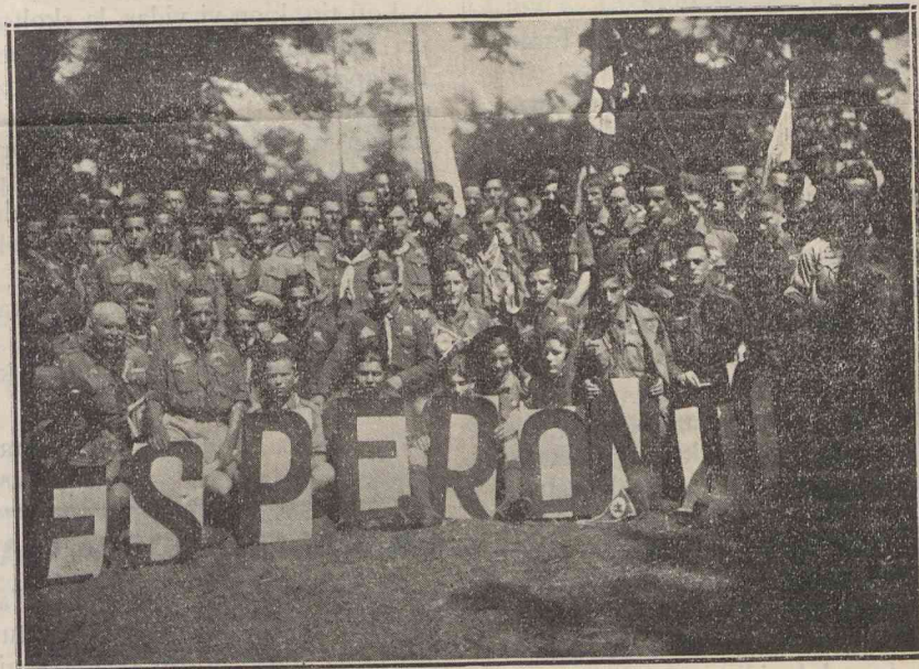
ESPERANTIRTAJ SKOLTOJ ĈE LA BUDAPEŝTA JAMBOREO

garujo, kune kun la kreinto de la Institucio, Lordo Baden-Powell eniras la kampon rajdante sur belaj ĉevaloj. La du ĉefuloj salutas la skoltaron tie kunigitaj. En tiuj emociplenaj momentoj, miloj da kolomboj estis liberigataj, kaj dum momento ili flugas nube malaperante en malproksimecon. Oni spiradas pacon kaj komprenemon.