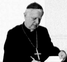
Abp Stanisław Wielgus

Urodził się 23 kwietnia 1939 r. w Wierchowiskach (obecna diecezja sandomierska). Arcybiskup senior warszawski. Profesor zwyczajny filozofii, dr hab. teologii. Był rektorem Katolickiego Uniwersytetu Lubelskiego (1989 – 1998) i biskupem plockim (1999 – 2007). Mediewista, specjalista w dziedzinie filozofii średniowiecznej. Członek 10 polskich i zagranicznych towarzystw naukowych. Od 2004 r. konsultor watykańskiej Kongregacji Wychowania Katolickiego.