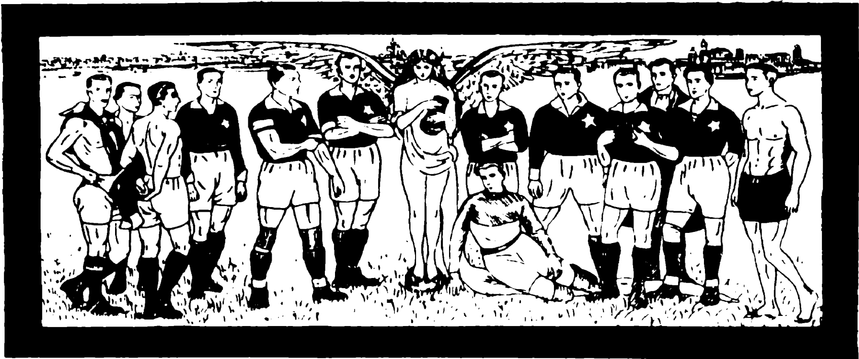
Bildo, prezentanta ĉefajn piedpilkludantojn de klubo Wisła (visŭa) el Kraków, pentrita de Vlastimil Hoffman kaj lokita en Palaco de Fizika Edukado en P. E. Ĝ.

Jen vidu: la infaneto-Polujo jam tuj post sia naskiĝo baraktis kun hereditaj malsanoj. Ĝia korpeto estis malfortika. La milito ruinigis ĉion. Tri partoj de Polujo estis antaŭe diverse regataj. Kiam Polujo restariĝis, minacis haoso. Kio estis permesita en unu parto, estis kondamnata en la alia parto. Preskaŭ neeble estis ĉion unuigi, ordigi. Diversaj, multflankaj malfacilaĵoj en ĉiu medio de la vivo ekaperadis. Kaj same, kiel en la vivo de la homo plej danĝerplena estas la periodo infana, same ankaŭ la unuaj jaroj de la reakirita ŝtata sendependeco de Polujo estis plenplenaj de danĝeroj, ĉiumomente minacantaj mortigi la ŝtaton-infanon.