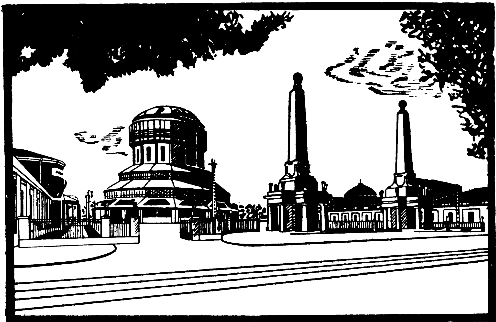
Enirejo al P. E. Ĝ. flanke de ĉefa stacidomo.

Ankoraŭ unu mencio: Ni aranĝis la Ekspozicion en Poznań. Ĝi estas facile komprenebla, ĉar la ĉefurbo de la ŝtato pro militaj okazintaĵoj ne taŭgis en ĉi momento solvi mil malfacilaĵojn, kiuj elkres-