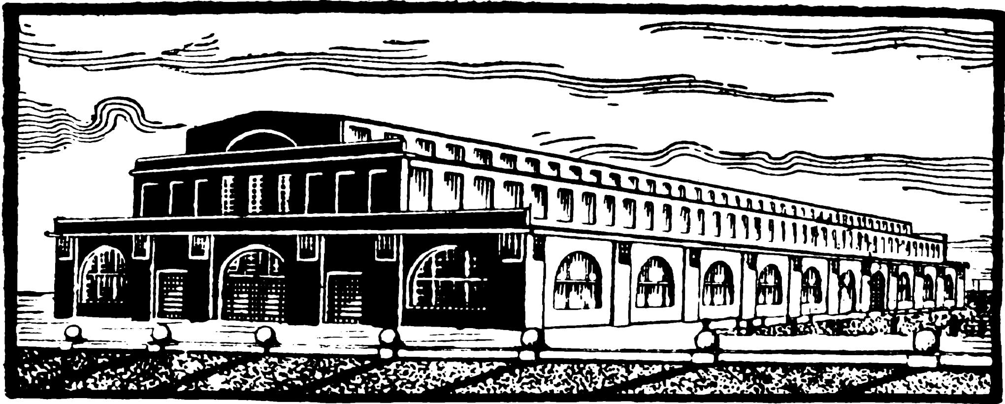
Halo de peza industrio en P. E. Ĝ.