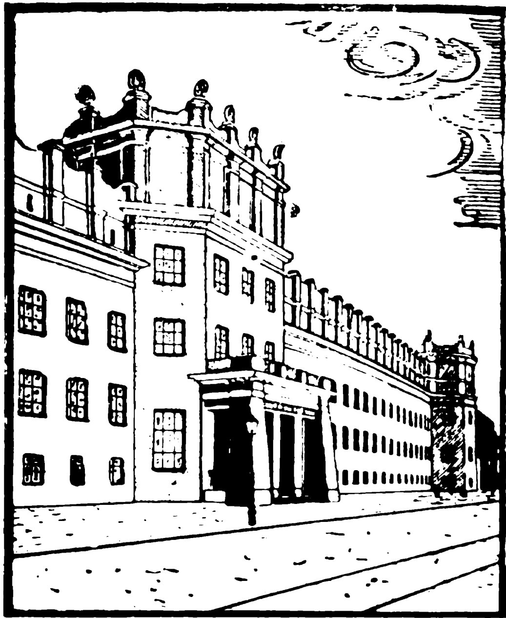
Fragmento de Registara Palaco en P. E. Ĝ.

ĉiuj atingajoj, sukcesoj kaj progresoj, akiritaj dum ĝia sendependa ekzistado.