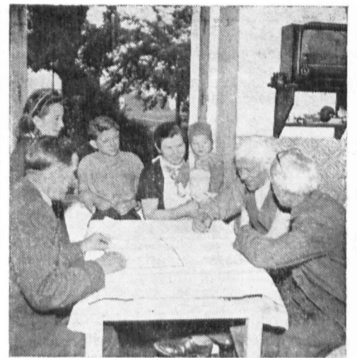
Ĉs. familio subskribas la postulon pri la Pakto de Paco.

La ĉeĥoslovaka popolo bone rememoras la munkenaĵon kaj neniam forgesos la tragedion de Lidice kaj Ležáky, la dekmilojn da plej bonaj filoj kaj filinoj de sia nacio, kiuj fariĝis viktimoj de la nazi-murdistoj. La ĉeĥoslovaka popolo porbatalas la pacon per sia konstruado de socialismo, plenumante la taskojn de la Kvinjar-Plano. Per la subskribo sur la porpaca voĉdonilo ĝi manifestas sian decidan volon konkeri la pacon, malebligigi la rearmadon de Okcidenta Germanio. Ĉiu subskribo sur la voĉdonilo reprezentas la forton, kiu helpas frakasi la planojn de la usonaj posteuloj de Hitler, ĝi plifortigas la heroajn porpacajn batalantojn en la kapitalistaj ŝtatoj kaj alproksimigas la epokon de homa feliĉo, travivata en krea laboro kaj paco.