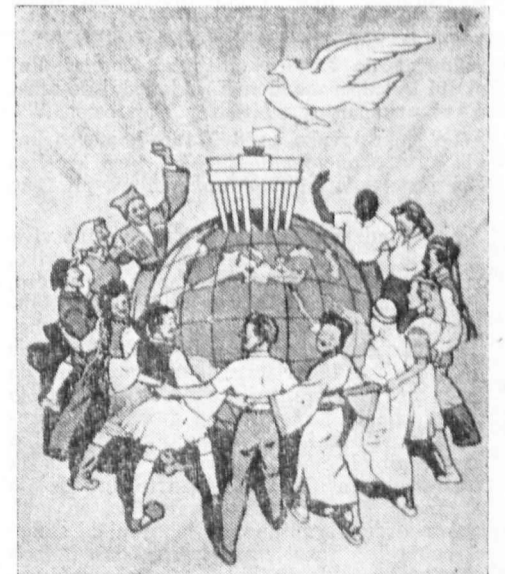
ANTAŬEN AL LA III-aj MONDLUDOJ de Junularo kaj Studentoj-Pacbatantoj EN BERLINO DE 5-a ĜIS 19-a DE AUGUSTO 1951.

● Respublika prezidento donis amnestion dum monatoj aprilo kaj majo al 104 personoj. El tio li pardonis aŭ moderigis la karcerpunojn al 90 personoj. La sumo de pardonitaj punoj estas 72 jaroj kaj 2 monatoj. En unu kazo li ordonis abolicion de akuzo pritraktado. Plue la respublika prezidento ordonis likvidi la postsekvojn de karcerana puno al 13 personoj.