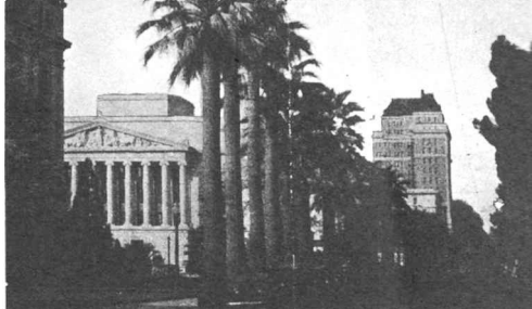
Sacramento—Palm Bordered Boulevards

Have you sent in your $3 for Congress Ticket, as a Participant-by-Mail, to help support the 1952 Congress?