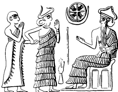
Rys. 2: scena prezentacji na pieczęci cylindrycznej z okresu III dynastii z Ur. ANEP 700.

Zatem, zgodnie z radą boga mądrości Ea, Atrahasis podczas epidemii powinien zaryzykować i całkowicie zwrócić się w stronę Namtara. Najwyraźniej gniew bóstw związanych ze światem podziemnym był postrzegany jako groźniejszy w skutkach aniżeli gniew bóstw opiekuńczych.