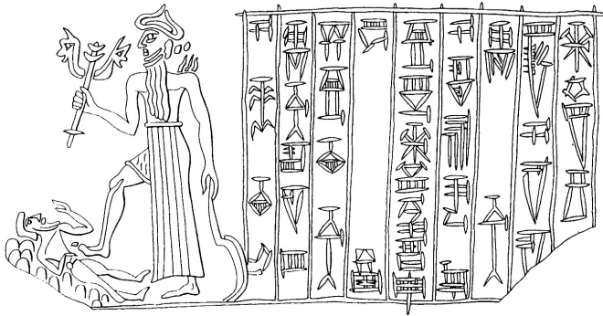
Rys. 3: starobabilońska pieczęć cylindryczna z Larsy przedstawiająca Nergala depczącego swą ofiarę. Nergal dzierży w jednej ręce sierpowaty miecz, a w drugiej swe charakterystyczne berło zakończone dwiema lwimi głowami. Black – Green, Słownik mitologii , 19.

Gniew boga podziemia określa tu przysłówek ezziš ('wściekle, gwałtownie, strasznie'), który jest świetną onomatopieją używaną dla określenia stanu wielkiego gniewu, ponieważ zawiera wyłącznie spółgłoski zębowe i wymówić go można tylko z zaciśniętymi zębami. Wyraz ten pochodzi od czasownika ezēzu ('być wściekłym, wpaść we wściekłość') 20 , jednego z najmocniejszych czasowników określających gniew w języku akadyjskim. Nie przypadkiem autor nie zastosował tutaj innego słowa dla przedstawienia zagniewanego, rozszalonego bóstwa, choć w odniesieniu do bogów bywają używane także inne czasowniki, takie jak: kaṃālu , šabāsu , zenū czy lemēnu . Użycie takiego słowa podkreśla z jednej strony stopień zagniewania boga świata umarłych, z drugiej zaś jego niebezpieczną moc. Tekst w dalszej części wyjaśnia, że winowajcą jest nie sam Kumma (czyli zapewne Asurbanipal), lecz jego ojciec, który „nie usłuchał słów,