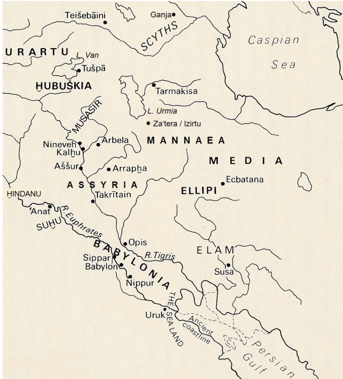
Mannaj i kraje ościenne

fal sejsmicznych ( jtmd ) i powstających szczelin ( qr c ) 19 . Podobne przekleństwo występuje u Jr 51,29, ale brak go wśród aramejskich złożeń w inskrypcji z Tell Fecherije, która pochodzi z IX wieku p.n.e. 20