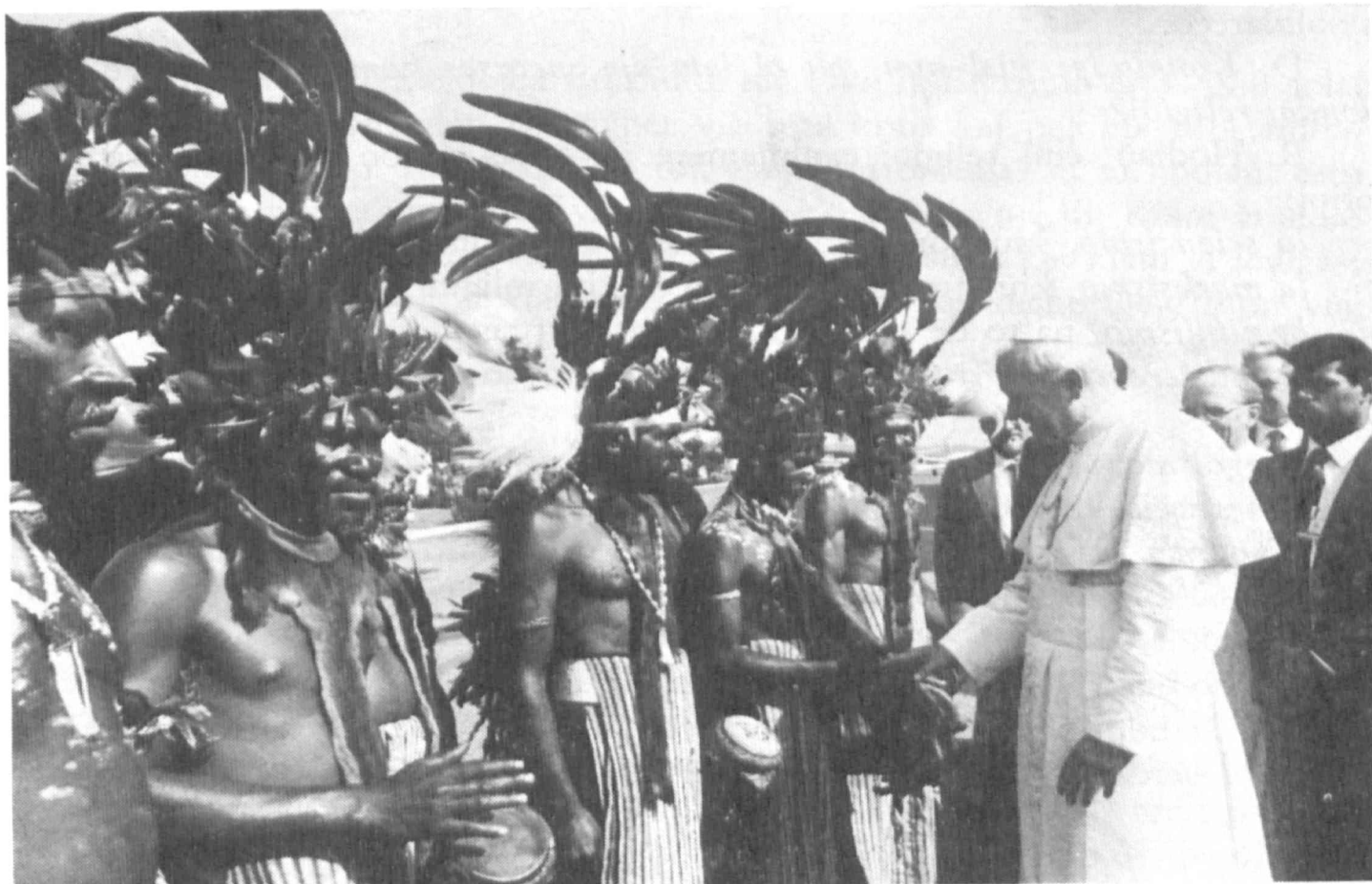
Ciuj religioj povas ricevi la Evangelion

R. Inter la grupoj alvenintaj al Romo valoras mencii tiun el la japana budhista laika movado Risoo Kosei Kaj . Kune kun katolikaj samaĝuloj el la tuta mondo ili partoprenis en la diversaj renkontiĝoj planitaj por la internacia Jubileo de la Junularo, esprimante, laŭ sia propra kredo, la sencon de la elaĉeto kaj de la repaciĝo. Aparte bela kaj kortuŝa estis ilia renkontiĝo kun