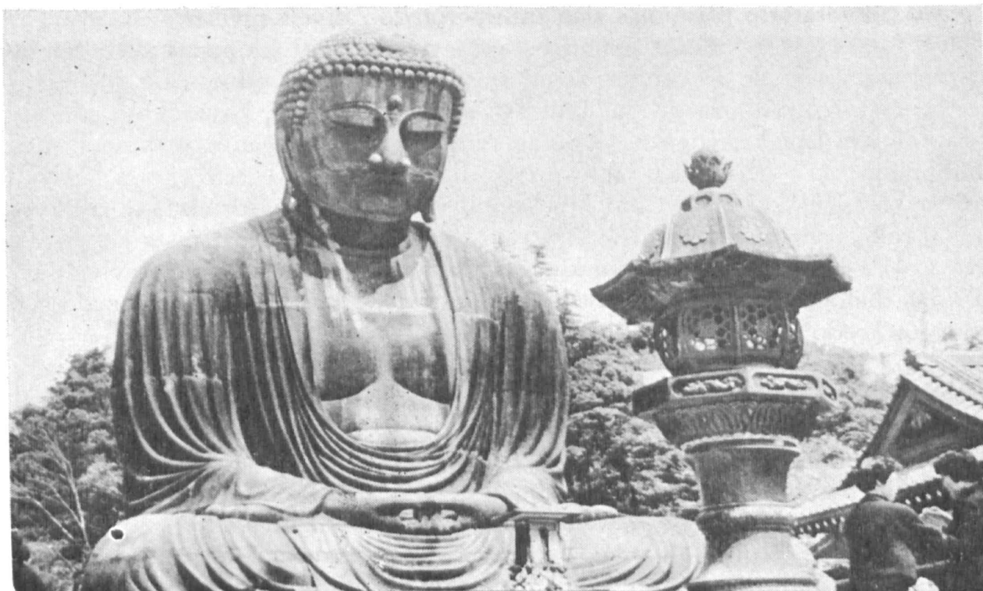
La katolika Eklezio respektas la moralajn valorojn de ĉiuj religioj

reprezentantoj de diversaj katolikaj movadoj en la sidejo de la Sekretariato. Estis vera kredo-dialogo, kiu konfirmis, ke ankaŭ la nekristanoj aspiras al la samaj valoroj de la Ĉiela Regno, kiuj estas la amo, la justeco, la paco, la libero, la solidareco.