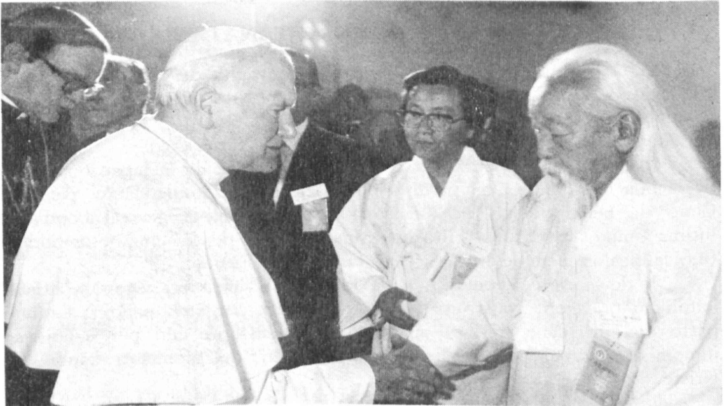
Johano Paŭlo la dua renkontiĝas kun reprezentantoj de nekristanaj religioj en Koreio