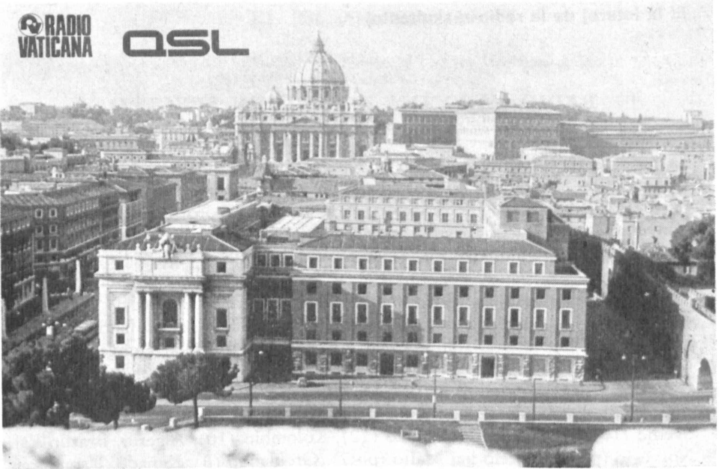
Detalo de bildkarto utiligata de Vatikana Radio por konfirmi la raportojn de la aŭskultantoj. La granda palaco videbla ĉe la antaŭo (laŭ la adreso «Piazza Pia 3») gastigas la redakciajn oficejojn