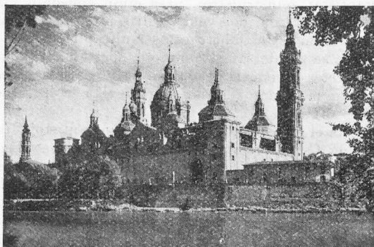
La rivero Ebro kaj la Baziliko «El Pilar»