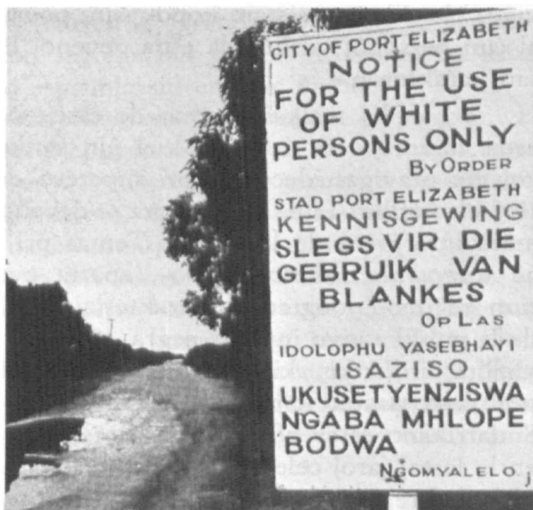
Port Elizabeth (Sudaŭfriko): strato rezervita al blankuloj

Bedaŭrinde multnombros la popoloj viktimoj de diversaj formoj de rasismo tra la mondo. Tamuloj en Srilanko, almigrintaj Afrikanoj kaj Azianoj en Eŭropo, Kurdoj en Mezoriento, Negroj en Nordameriko, Indianaj gentoj en la Amazona praarbaro, Hutu-nacieco en Burundio, Neblankuloj en Sudaŭfriko, Palestinanoj en Izraelio: jen kelke el la plej konataj kazoj de popoloj, kiuj