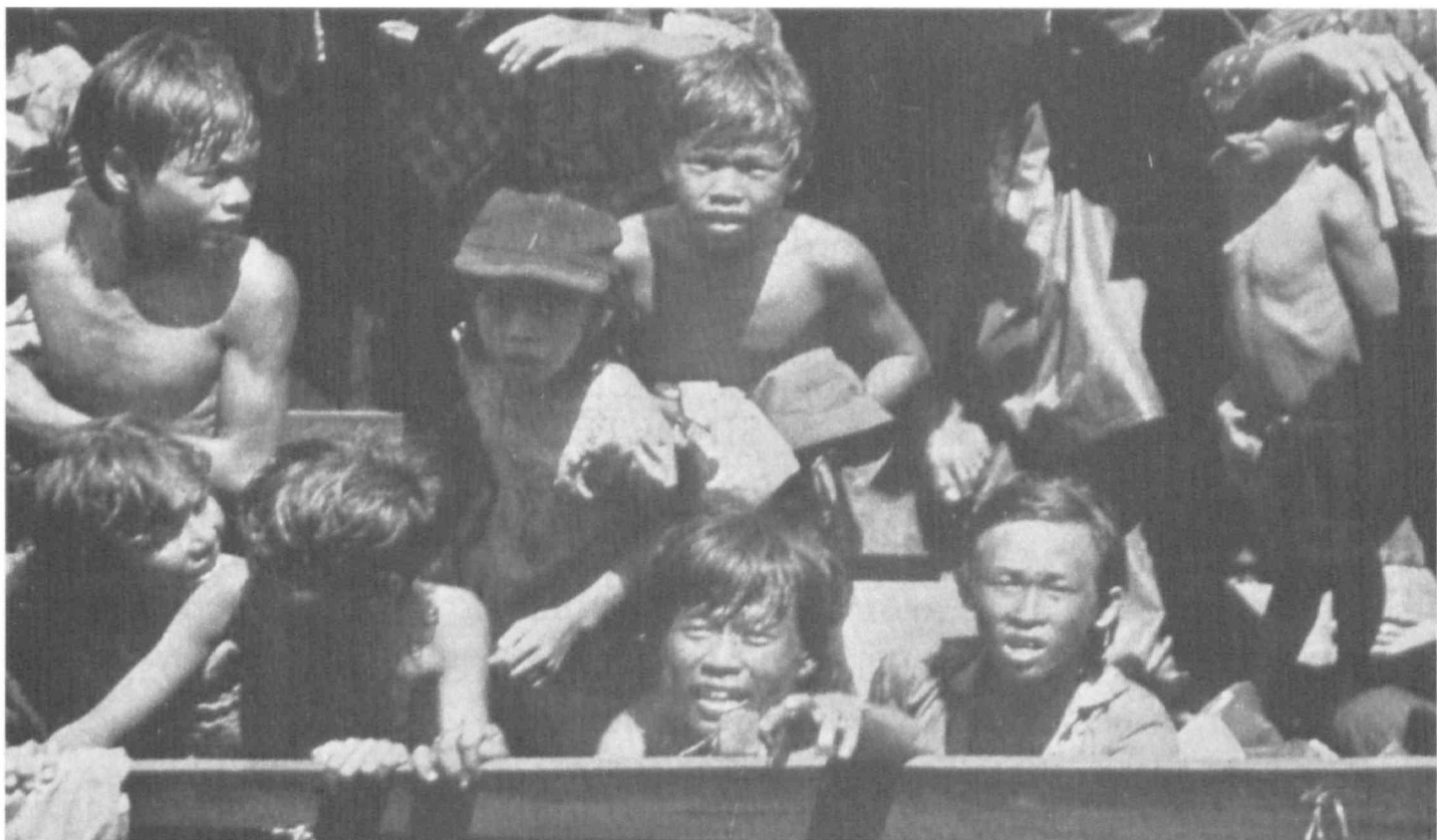
Vjetnamaj rifuĝintoj ĵus savitaj en la Ĉina maro

persekutado. Preskaŭ ĉiuj gastigantaj landoj estas implikitaj en tiu problemo. Multaj landoj laŭte trompas la internacian opinion, ke ili estas gastigemaj, sed ili vere estas mistraktemaj. Kiel en Sudafriko, tiu apartisma sistemo speguliĝas en la vivo de la rifuĝintoj: enfermitaj en kampadejoj, de kie ili ne povas eliri sen permeso, ili similas al la malfeliĉaj sudafrikaj negroj, kiuj ne rajtas eniri blankulajn urbojn sen permeso. Ili laboras kaj estas katenitaj en fermita cirklo, disigitaj de la resto de la mondo. Kutime rifuĝintoj ne rajtas labori sen speciala laborpermeso; kaj en multaj kampadejoj la estro rajtas meti rekte en malliberejon pretendatajn kulpulojn, ankaŭ sen la konsento de la polico aŭ de la juĝisto. La leĝoj aparte faritaj por aŭ kontraŭ rifuĝintoj, la malamo kontraŭ fremduloj ( ksenofobio ), la deturno de helpaj projektoj, vole aŭ nevole kreas segregacion inter rifuĝintoj kaj nerifuĝintoj.