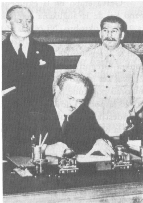
La subskribo de la fifama Pakto Molotov-Ribbentrop

La 26-an de aŭgusto la papo publikigis du dokumentojn "okaze de la 50-a datreveno de la komenco de la dua mondmilito": unu apostolan leteron kaj unu mesaĝon al la polaj episkopoj. La hebrea amasbuĉado, kiu restos "por ĉiam hontaĵo por la homaro"; la forneo de la suvereneco de Pollando kaj de la Baltaj landoj, "mortkondamnitaj" per la Molotov-Ribbentrop-pakto; la karaktero de "totalisma ideologio", kiu kunigas "la naziisman paganismon kaj la marksisman dogmon"; kaj la neceso de memkritiko de la kristanoj, estas la ĉeftemoj de la du papaj dokumentoj. La papo alvokas la kristanojn al memkritiko, ĉar "la abomenaĵoj de tiu milito manifestiĝis en la kontinento, kiu plej longtempe estadis sub la radiado de la Evangelio kaj de la eklezio. La falo de la kristanaj valoroj, kiu favoris la hieraŭajn erarojn, devas igi ni viglaj pri la manieroj, kun kiuj hodiaŭ la Evangelio estas anoncata kaj travivata".