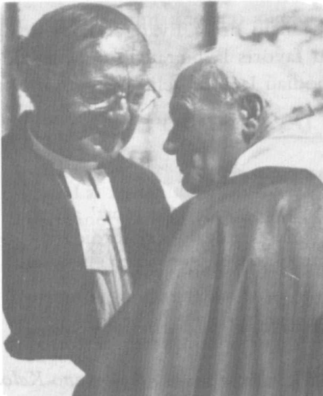
La renkonto inter Johano Paŭlo la Dua kaj ĉefepiskopo Runcie

“Al Tiu kiu en ĉio povas fari multe pli ol ni povas peti aŭ pensi, estu gloro en la Eklezio kaj en Kristo Jesuo ĝis ĉiuj generacioj por ĉiam kaj eterne. Amen ” (Efe 3,20-21).