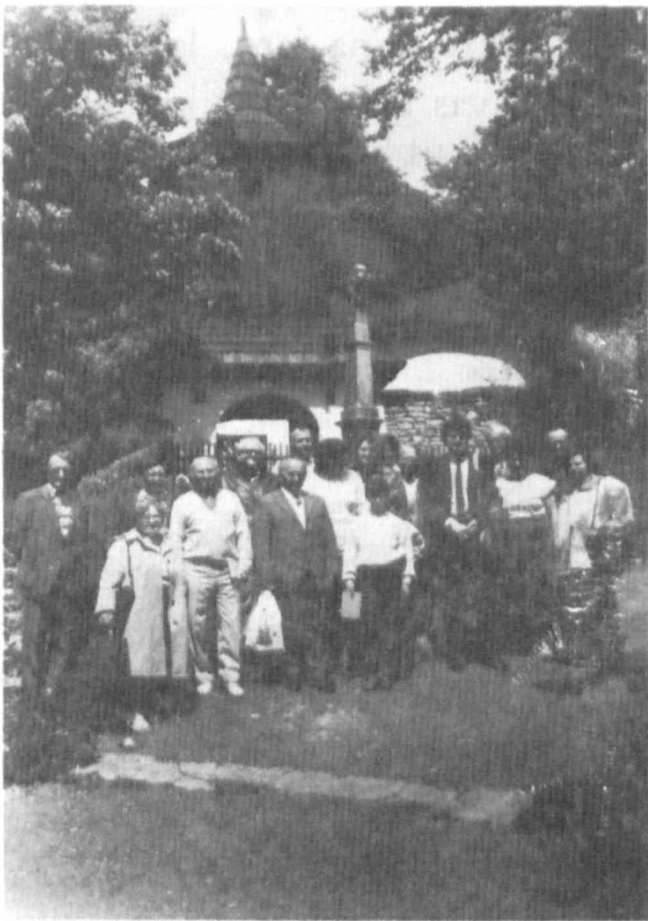
Parto el la kongresanoj antaŭ la Preĝejo de S. Katarina

La eta Kapelo svarmas je personoj. Multaj gejunuloj. La tri liturgiaĵoj okazas en sentoplana kaj intensa etoso. Fine, ankoraŭ momento da komuna preĝado, kaj ĉiuj eliras silente, konsciaj pri la grava travivita momento.