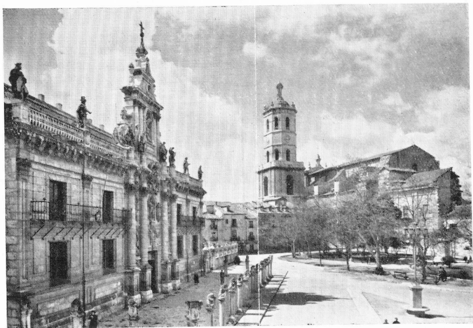
Valladolid.—La Universitato kaj la Katedralo.

La venonta Kongresurbo prezentas belajn monumentojn kaj senkomparejn artaĵojn. La tuta urbo estas vera muzeo de pasintaj tempoj kiuj skribis sur fasadoj kaj muroj sian gloran historion.