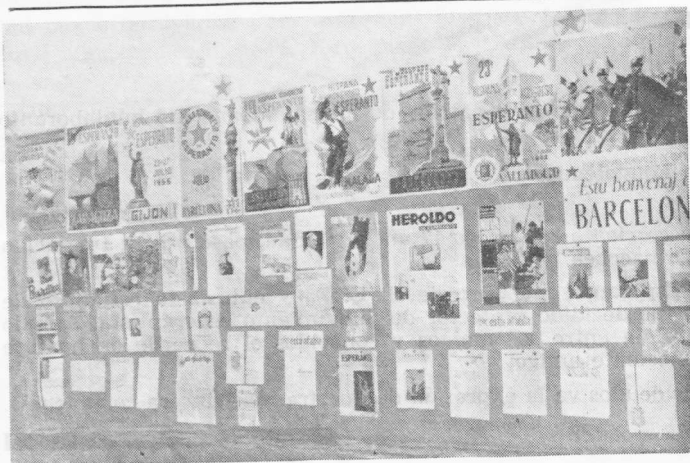
Vista parcial de la interesante exposición Esperantista organizada en EL FERROL DEL CAUDILLO, con motivo del día de Zamenhof.