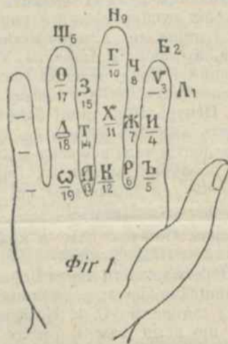
„Календар в руці.“

Купуйте „Товариша“, багато ілюстрований календар на 1902. рік.