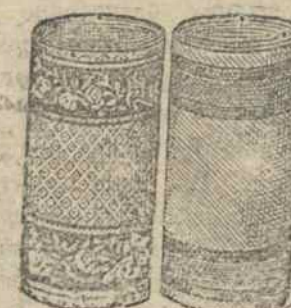
Наші низькі ціни викликують сензацію