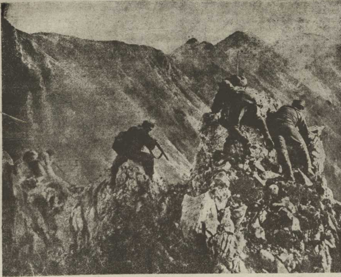
Тирольські стрільці острілюють в Дольмітах італійський відділ.

а від перетриманих коров буде мати ще й молоко. На перезимоване повинні брати таку худобу також горальні на брагу, а денеди і фільварки, коли мають пашу, а худоби не мають. В таких случаях, коли господар зимуючий чужу худобу і коні, не буде мати з того такого хісна як варта викормлена паша і обхід, буде давати правительство відповідне відшкодоване так як дав на удержане бугаїв. Президія намісництва віднесла ся вже до міністерства рільництва о дозвіл о виплату відповідних премій як відшкодованя і на дієть ся, що міністерство на все в найблизшій часі згодить ся. Таке віддаване худоби і коний на зимоване може в високій мірі запобічи випродукованю.