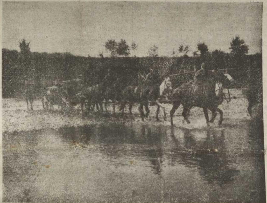
Трен українських січових стрільців.

Свобода не побирає ніяких запомог ні від Москалів, ні від Ляхів, є справді селянською газетою, котрої існуванє опираєть ся виключно на передплаті. Тому прихильники