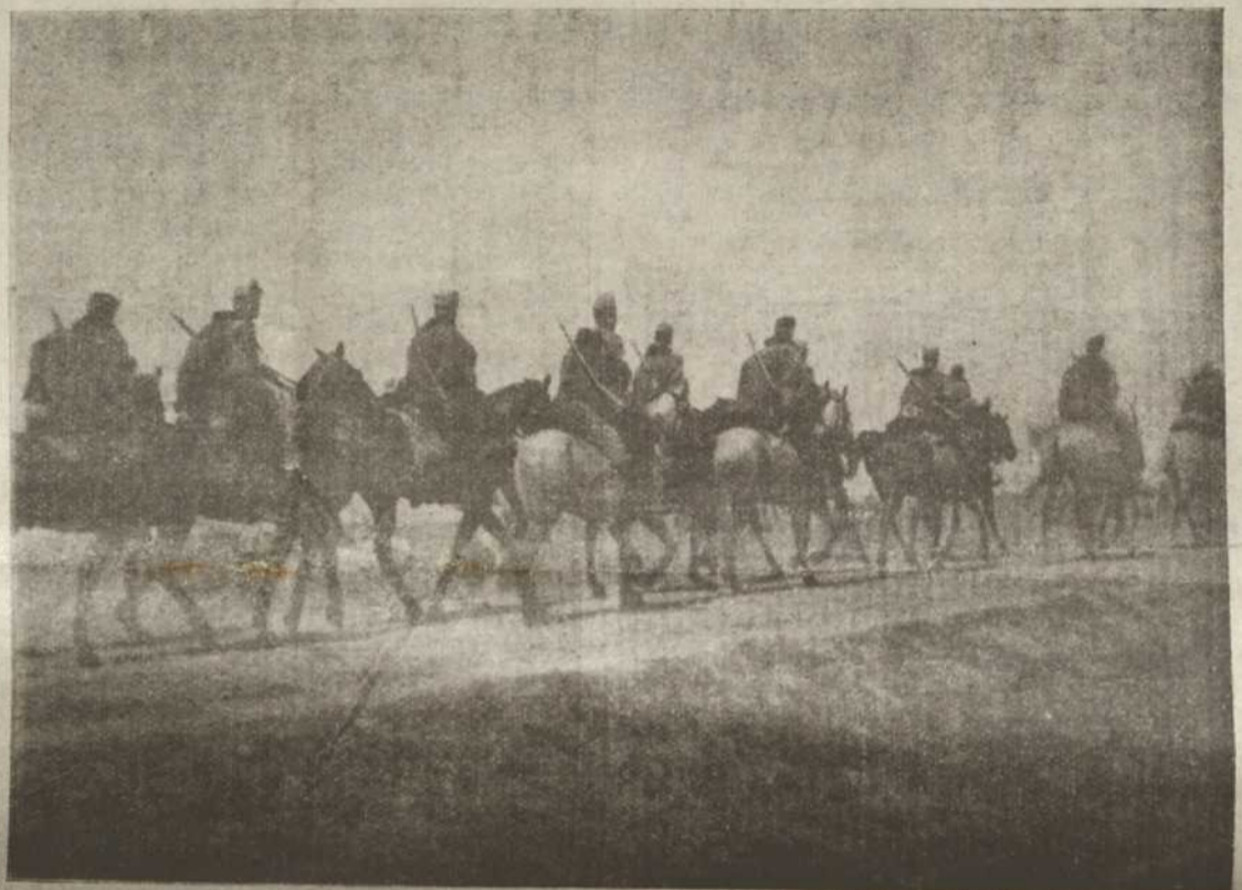
Кавалерія українських січових стрільців.

Ми віримо, що по війні настануть для нас красші часи, що ми в Австрії одержимо ширші права, як мали їх перед війною. Ми віримо, що і закордонна Україна скине з се