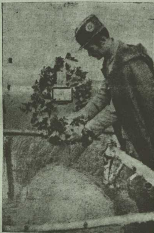
Український січовий стрілець складає вінок на гробі німецького жовніра в селі Рогізно в самбірським повіті.

Жовківський пов'т належав до найбільше закацапщених повітів в цїлій Галичині. Причина сего була та, що перемиська консисторія, де все аж до послїдних днів верховодили москвофільські каноніки, при помочи