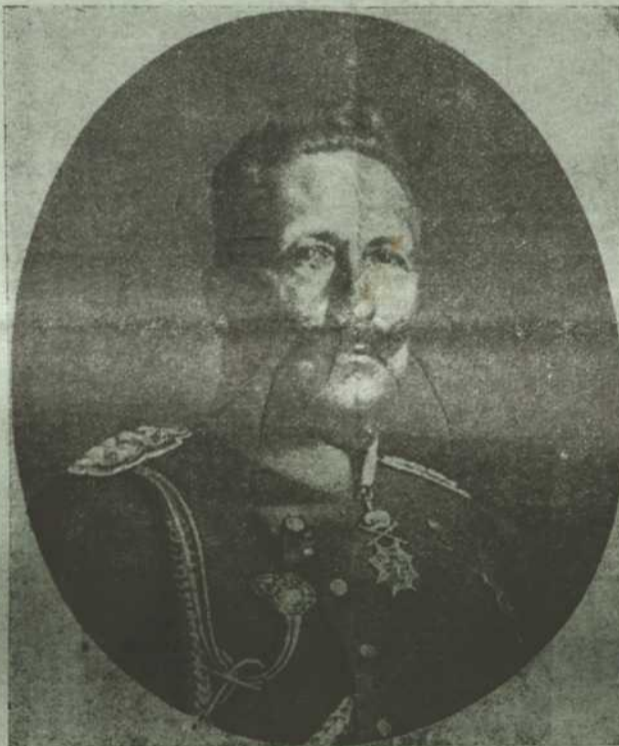
Німецький цїсар Вільгельм II.

Та вже найбільше можуть причинити ся до усуненя пянства і марнотравства наші уряди громадські. Користаючи зі свого права, повинен кождий начальник громади обмежити у своїй громаді продаж горячих напоїв. Передовсім повинен безуслівно заказати продаж горячих напоїв у всі свята і неділі і на той час приказати замкнути коршму; до сего кождий вїт в інтересі добра громади має не