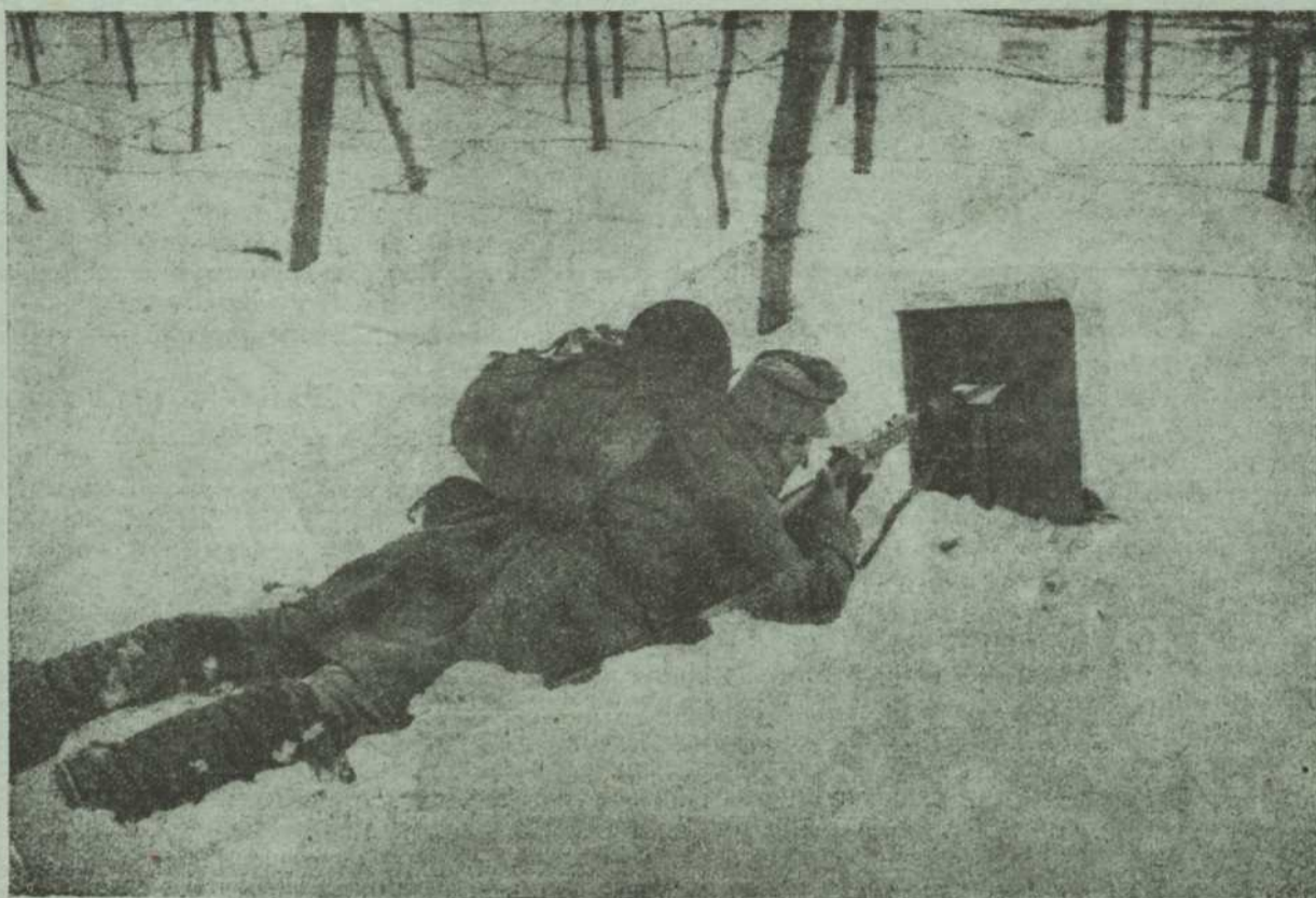
Наш жовнір в розстрільній (в швармлії) з охоронною сталевною плитою в Топорівцях на бесарабській границі.

Сапов. По голові, по крижах, по руках, по ногах, де засяг... От прошу, які синці...“