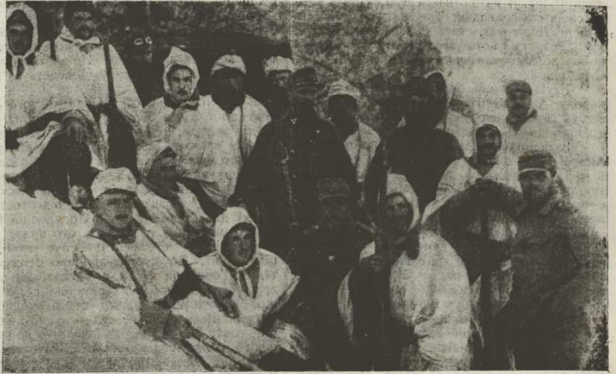
Віддїл австрійських жовітрів на італійськ фронті, прибраний для непізнання в білі накривала.

Тепер Тобі напишу, як ми жїємо. Насамперед прийшов приказ, що всі люди зі села мають вибирати ся до Росії. В селі повстав великий плач і крик; настала страшна година. Однак недовго опісля прийшла відомість, що до Росії можуть переберати ся люди, які самі хотять. То всі лишили ся, тільки священник спакував свої річі і вивіз. На другий день прийшли Москалі забирати дзвони. Люди зїшли ся з цїлого села, нікому робота не була мила. Остатний раз стали дзвонити. Одні відходили, другі приходили і казали: „Дзвонім самі по собі, бо вже по нас дзвонити не будуть“. Дзвонили від рана до полудня, не переставали. З плачем про-