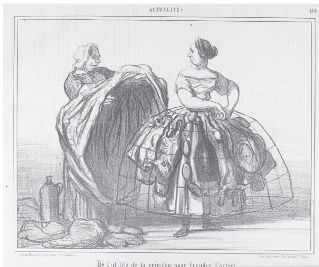
Figure 3. Daumier, « Actualités. De l'utilité de la crinoline pour frauder l'octroi », Le Charivari , 19 juin 1857.

qu'elle compromet son honneur. À moins qu'elle sache parfaitement à quoi s'attendre dans cet atelier, où le service poli et discret qu'on y promet pourrait avoir la teneur d'une rencontre galante, sous couvert de la nécessité de suivre la mode.