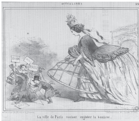
Figure 5. Vernier, « La ville de Paris voulant englober la banlieue », Le Charivari , 6 novembre 1858. BnF.

un procédé qui est assez courant : sur les images de l'époque, le volume des jupes, même s'il n'est pas déformé jusqu'à la charge, sert fréquemment à souligner la différence de statut social entre deux femmes représentées (p. ex. la relation « patronne-servante » ou « bourgeoise-paysanne »).