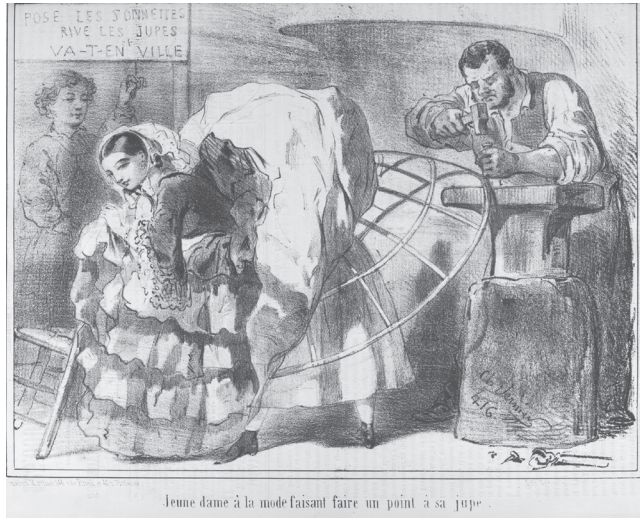
Figure 1. Vernier, « Jeune dame à la mode faisant faire un point à sa jupe », Le Charivari , 8 novembre 1856.

rons. Ce motif de l'ouvrier prenant la place de la lingère est d'ailleurs exploité bien volontiers par la caricature de l'époque 1 .