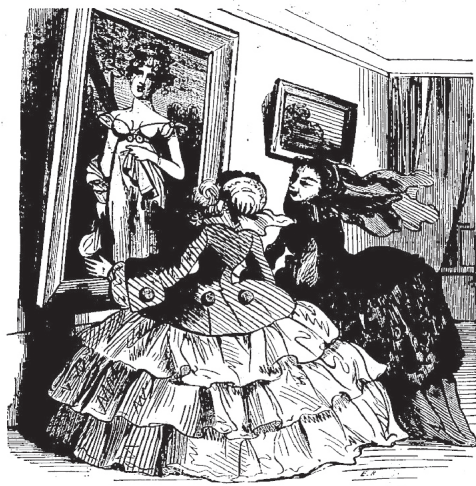
1857 Dis donc, ma chère, comment ta mère a-t-elle pu porter une mode aussi ridicule.

Figure 6. Rossignon, « Dis donc, ma chère, comment ta mère a-t-elle pu porter une mode aussi ridicule. », Journal amusant , 16 mai 1857. BnF.