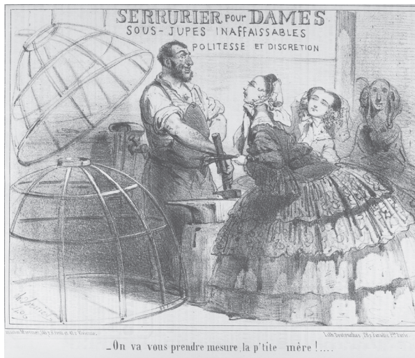
Figure 2. Vernier, « - On va vous prendre mesure, la p'tite mère », Le Charivari , 28 août 1856. BnF.

laissant entendre que la prise des mesures n'est pas un acte tout à fait innocent. Adoptant une attitude révérencieuse devant le fabricant de crinolines, la cliente semble subjuguée par ses services et aveuglée par la mode, sans s'apercevoir