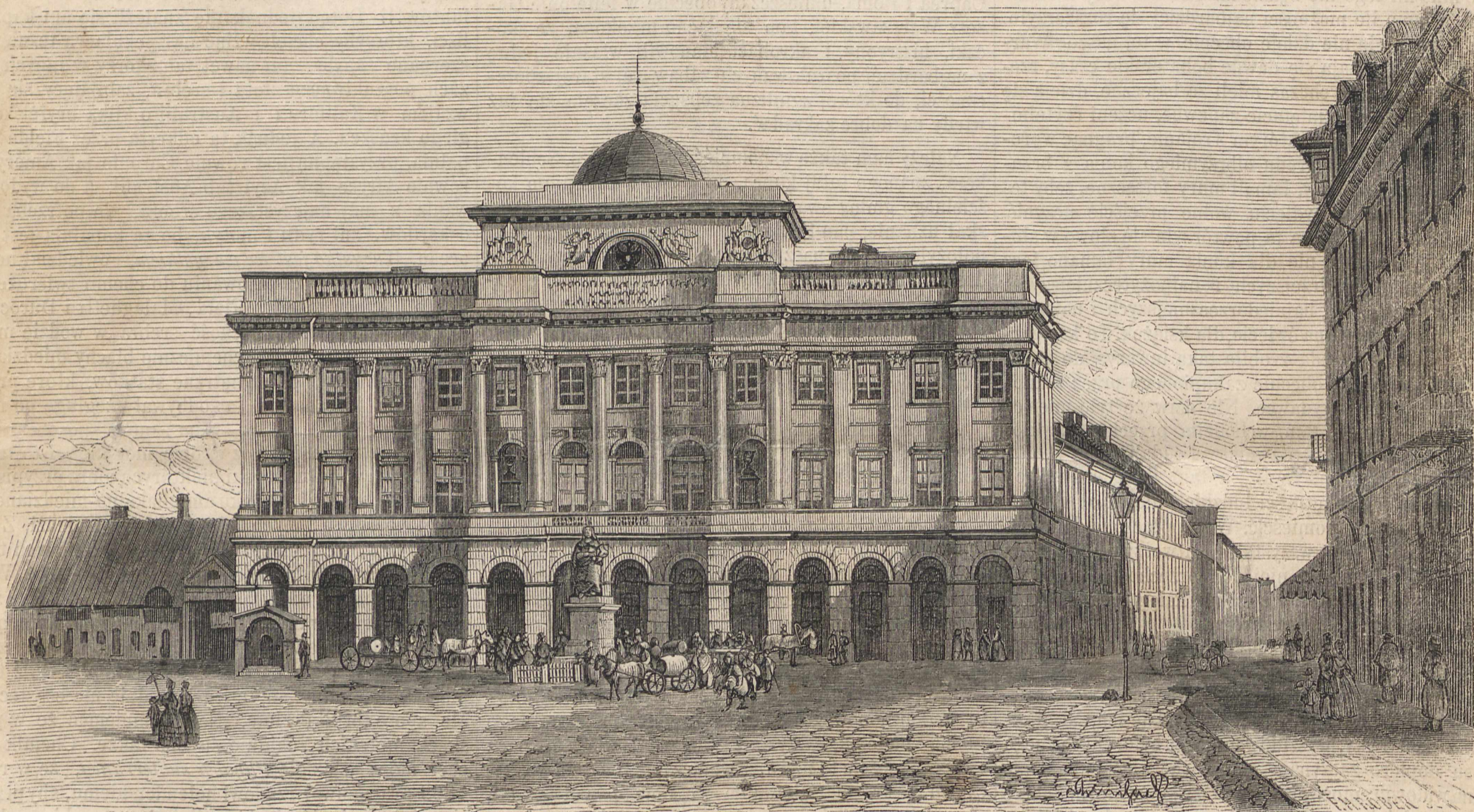
AKADEMIA MEDYKO-CHIRURGICZNA W WARSZAWIE.

Akademia medyko-chirurgiczna, założona w roku 1857, pierwotnie pomieszczoną być miała w domu