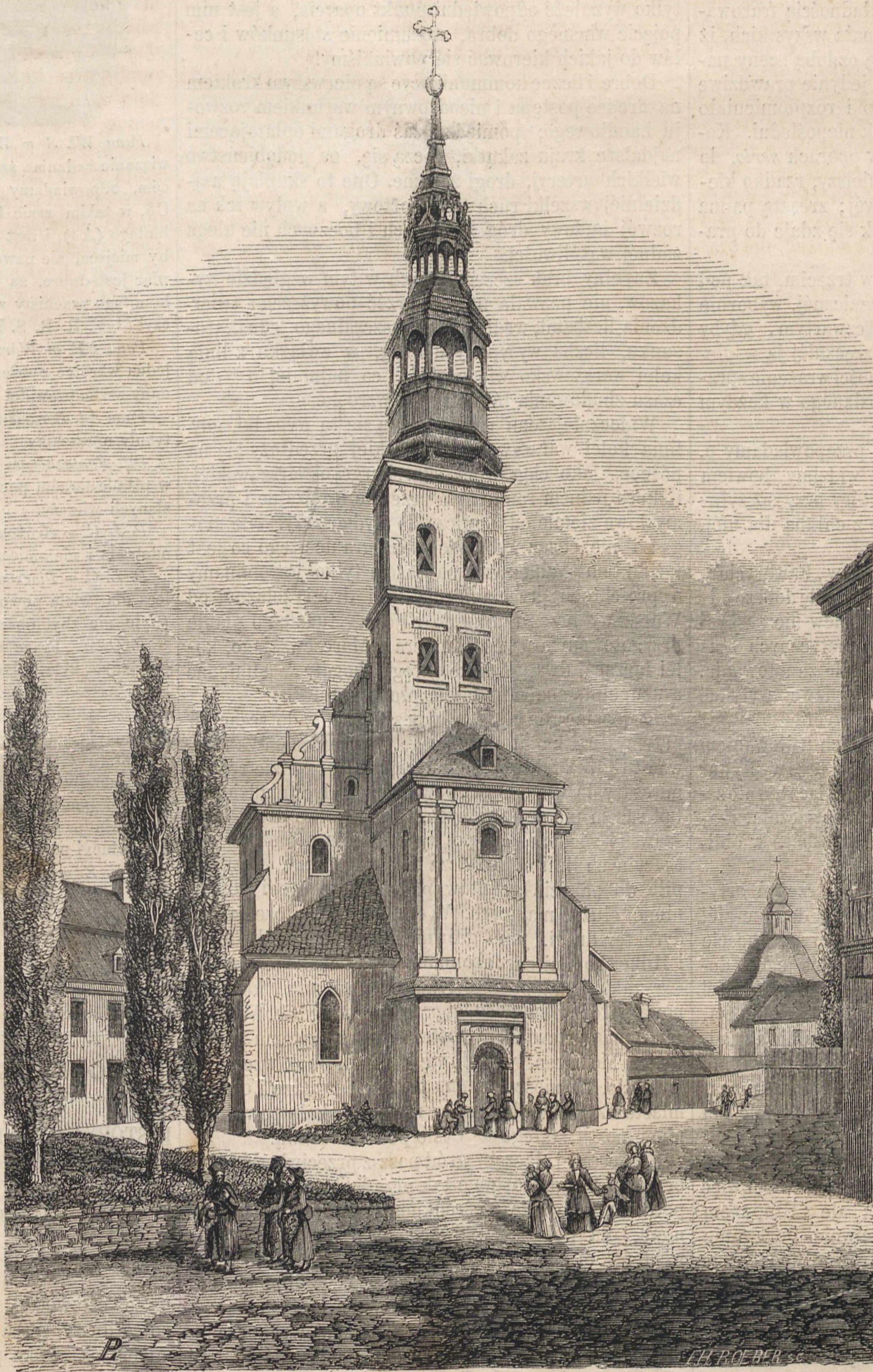
KOŚCIÓŁ Św. MICHAŁA W LUBLINIE.

sceniczną paraliżuje. Tylko potężna zarozumiałość, lub zupełna nieznajomość artystycznej odpowiedzialności, osłania w części występującego przed owymi srogimi skutkami wewnętrznej obawy. Zresztą debutanci w operach, najczęściej o śpiewie tylko myślą, poświęcając inne warunki sceniczne jego wyłącznie dokładności. „Co to szkodzi, mawiają, że nie umiem chodzić po scenie, że nie wiem co rękami robić, jak co powiedzieć? Bylebym tylko dobrze śpiewał, byle ta arya się udała, byle górne H lub C wyszło gładko i bez przypadku z piersi, a wszystko będzie jaknajlepiej; śpiew to grunt, nie dbam o resztę.“ I w tém się ogromnie mylą. Ci co tak myślą, nie posiadają iskierki nawet z tego świętego ognia, rozpło-