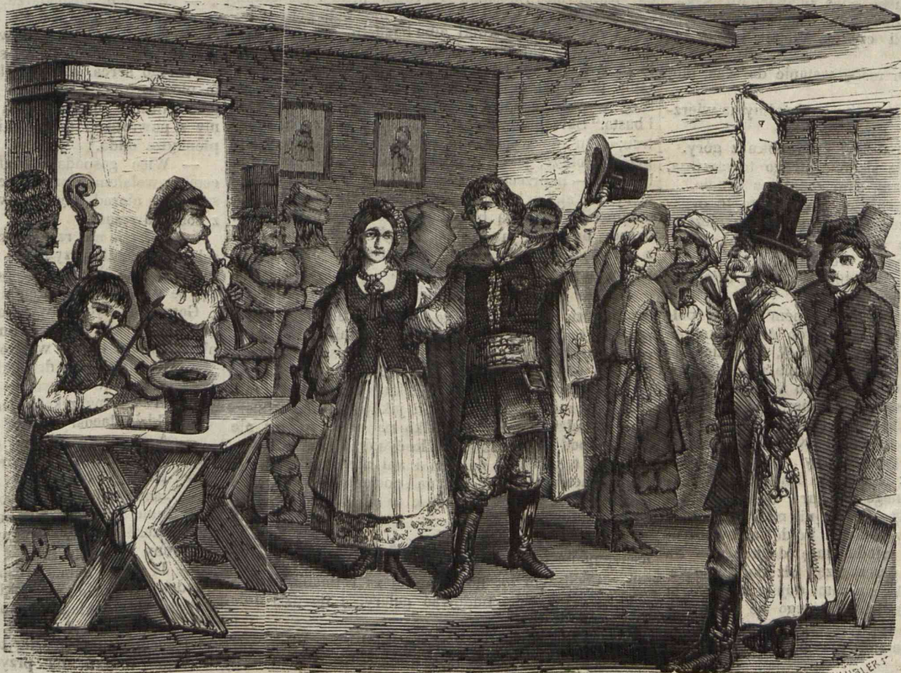
Nie masz ci to, nie masz jako parobczek . . . (Układ i rysunek Kostrzewskiego).

bniuchnego państwa. Teraz przyszła kolej na poznanie stron jego południowych. Klasztor bernardynów w Alwernii, zwaliska zamku lipowieckiego, Bóbrek, w którym niegdyś dzielnie trzymali się konfederaci, oto cel mój wycieczki. Na rok przyszły zamierzałem