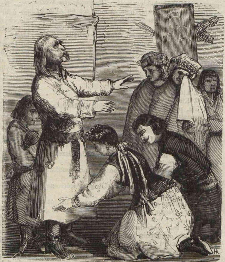
Błogosławię wam, moje dzieci, w imię Ojca i Syna i Ducha świętego. (Układ i rysunek Kostrzewskiego).

Po zmiesieniu zakonu jezuitów, założyli tu szkoły bazylianie i utrzymywali je do r. 1793. Następnie urządzono w Ostrogu seminarium greckie, które przeniesionem zostało do Annapola w r. 1821. Smutno wspomnieć doprawdy, że miasto to, mające niegdyś akademią, drukarnią, kolegium, szkoły, seminarium, dziś, w połowie XIX wieku, wieku postępu i cywilizacji, zawiera w sobie tylko nędzną powiatową szkołę o 3ch klassach, liczącą zaledwie trzydziestu kilku uczniów.