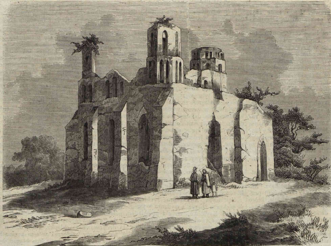
ZWALISKA ZAMKU OSTROGSKIEGO OD STRONY POŁUDNIOWEJ. (Rysował na drzewie Podbielski).