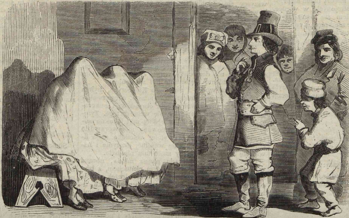
Pan młody stanął przed okrytymi niewiastami, namyślał się długo, wreszcie pochwycił siedzącą w środku starą Frankową. (Układ i rysunek Kostrzewskiego).

Od strony okna za węższym brzegiem stołu posadzono państwa młodych, po prawej stronie ksiądz bernardyn, po lewej stary swat i inni gospodarze i gospodynie. Drużbowie pilnowali, żeby miski przed gośćmi nie były próżne i szklanki puste. Mnie się dostało siedzenie obok bernardyna, co było wielkim zaszczytem, gdyż żadnemu kawalerowi nie wolno było siedzieć przy stole, podobnie jak i dziewczętom, które w kącie izby przy osobnym stole zajadały, ale jak uważałem, bardzo skromnie. Rzęsiście szły kolejne zdrowia, to miodem, to winem, to państwa młodych,