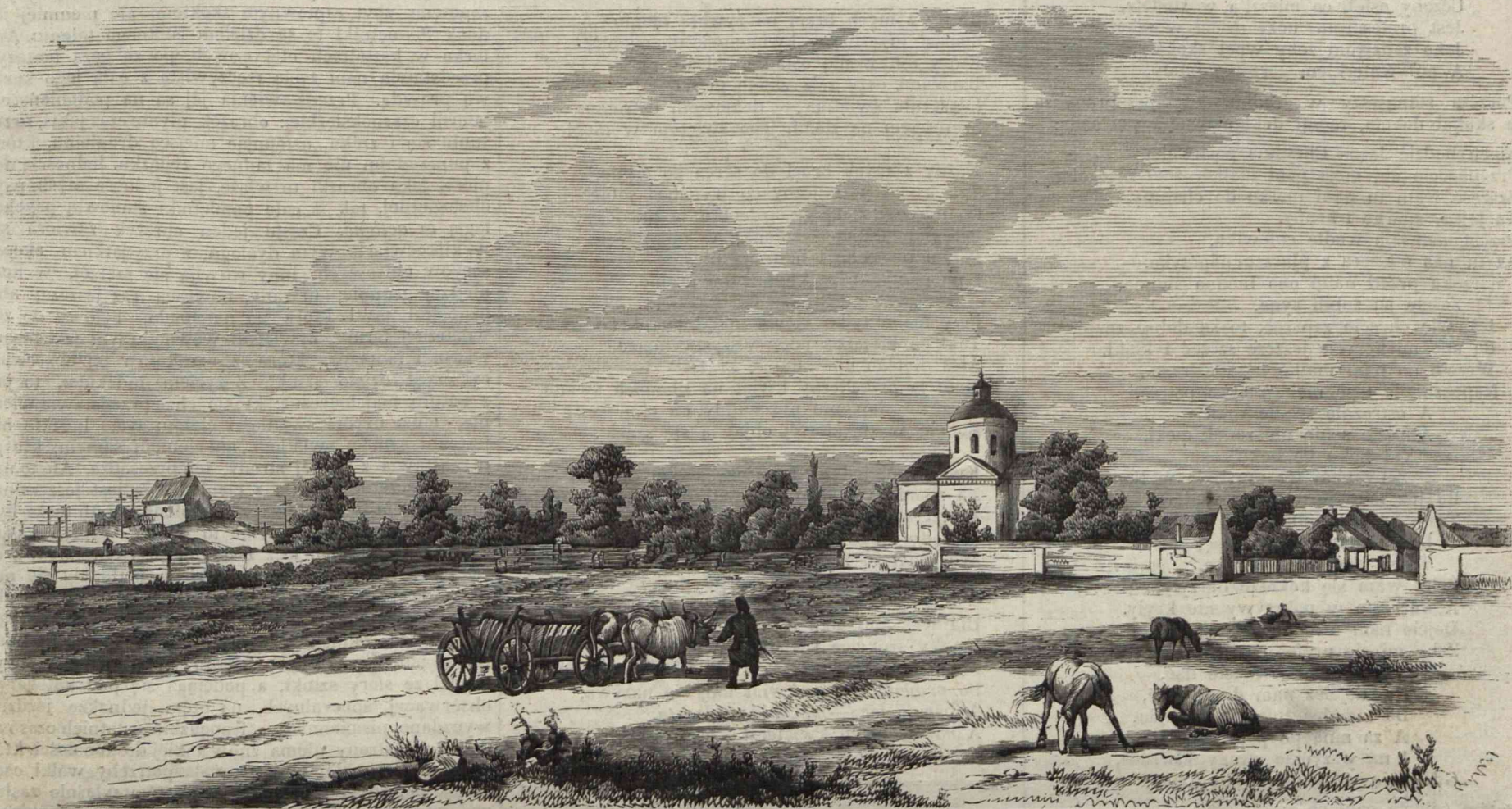
ZŁOTOPÓL (STANNICA HULAJPOLSKA). (Rysował z natury Przyszychowski).

Dzisiejszy kościółek przebudowany i powiększony został w roku przeszłym, staraniem miejscowego proboszcza ks. Jaworowskiego. Schludny on, ale ubogi. Nie posiada dawnych pergaminów, ani obrazów znakomitego pędzla, bo powstał równocześnie z tymi