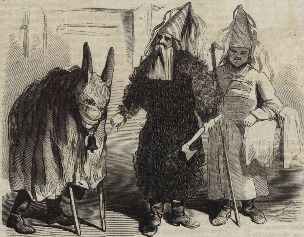
„Ja jestem Zapust, mantuńskie książe.“ (Układ i rysunek Kostrzewskiego).

Ale niestety, raj ziemski był krótkotrwały; to też i te serdeczne przyjaciółki lada fraszka śmiertelnie poróżnić może. Jedno słówko dostatecznym jest ażeby zgubny pożar rozniecić i słodkie oświadczenia przyjaźni zamienić w długą i zawziętą kłótnię. Wtedy