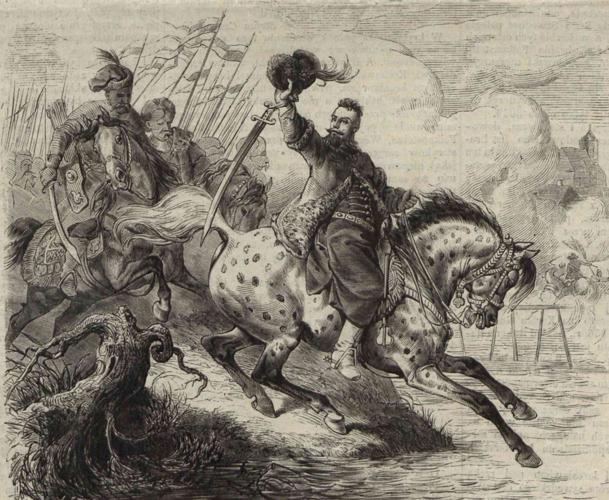
Ścisnąwszy konia ostrogami, pierwszy rzucił się w nurt rzeki. (Pomysł i Rysunek Kossaka).

Na wieść o tych ruchach, Karol Gustaw, stojący w 18,000 pod Zamościem, widząc że bez ciężkich dział oblężniczych twierdzy tej nie weźmie, pociągnął ku Sandomierzowi, połączywszy się w drodze z Duglasem. Odwrót ten nazwać można raczej mozolnym, wśród ciągłych utarczek wleczeniem się, jak pochodem.