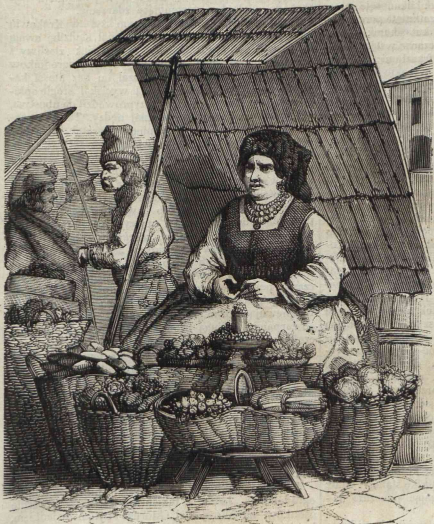
OGRODNICZKA KRAKOWSKA. (Układ i rysunek Kostrzewskiego).

ryalny gorset, od dołu zdobny organkami (*); na głowie czerwona kwiecista chustka, zausznice złote z granatkami, kilka sznurów wielkich, kosztownych korali na szyi, siedzi i palcami zdobnymi w srebrne pierścienie z koralowemi oczkami, łuszcze strączki i grochu