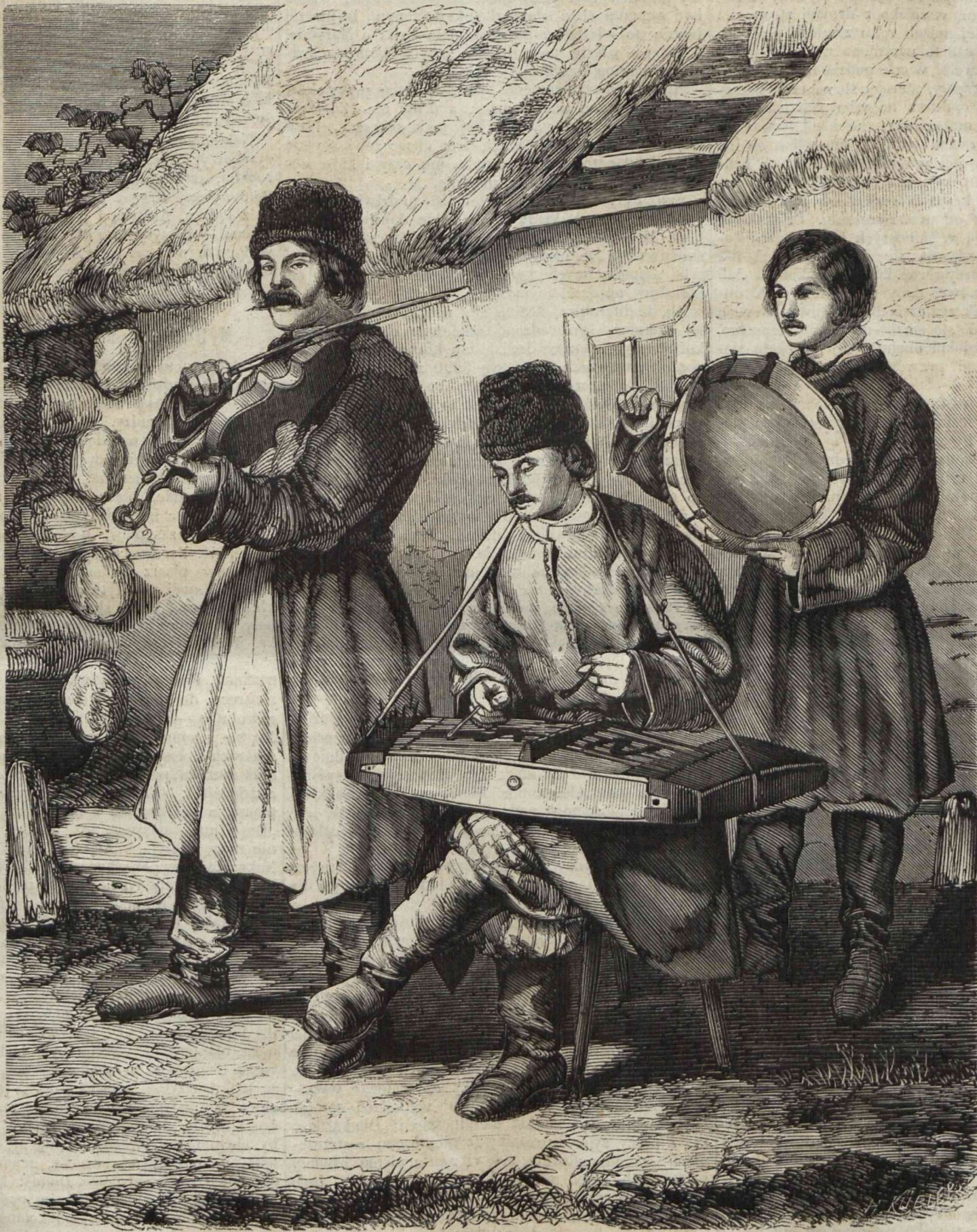
MUZYCZY UKRAIŃSCY. (Rysował z natury Przyszychowski).

Plac Szczepański, jest to sobie skromny kawałek zie-