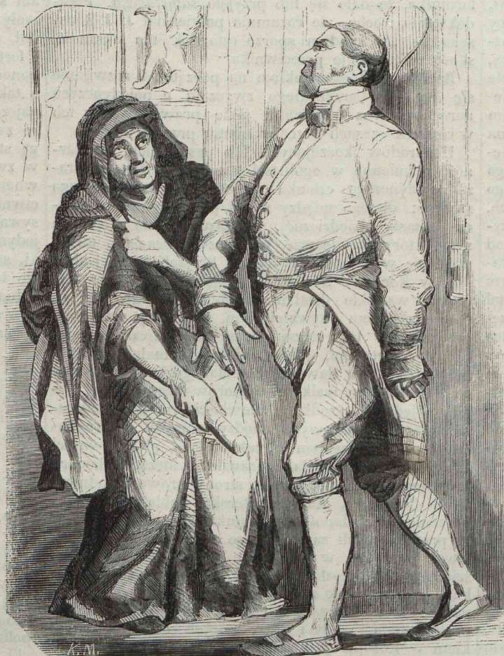
LOKAJ SPANOSZONY. (Szkic Cypryana Norwida).

korzenie powinno być dążnością każdego kraju, bo wystawiają życie i zdrowie obywateli jego na igrzysko ślepego trafu. Już Montesquieu w swoich „Lettres persanes“ (list 91) dobrze powiedział w tym przedmiocie: „Taki sposób rozstrzygnięcia sporów bardzo jest niewłaściwy; z tego bowiem nie kto jest zręczniejszy lub silniejszy od drugiego, nie wypływa wcale że ma słusność po sobie.“ Powstaje więc pytanie, ja-